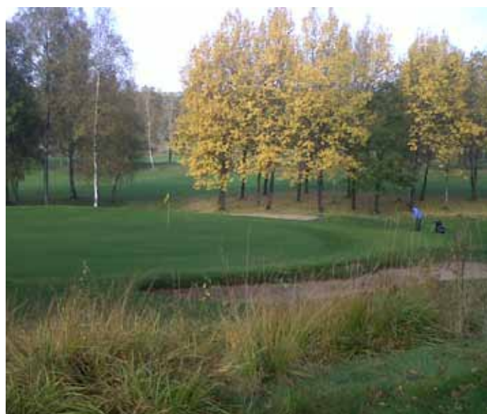
Foto 14. Parkupplevelse på Örkelljunga GK, Sverige.