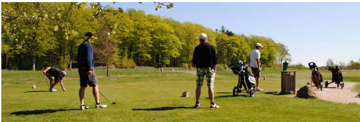
Foto 36. Stenmur längs med skogsranden. Muren är mer än 100 år gammal. Hornbæk GK, Danmark.