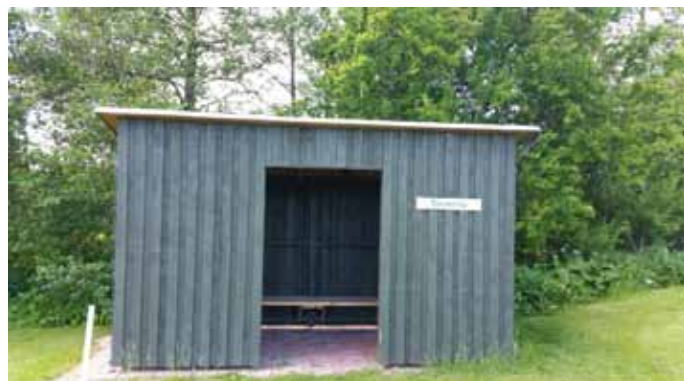
Foto 52. Åsk- och väderskydd på Sydsjællands GK, Danmark.