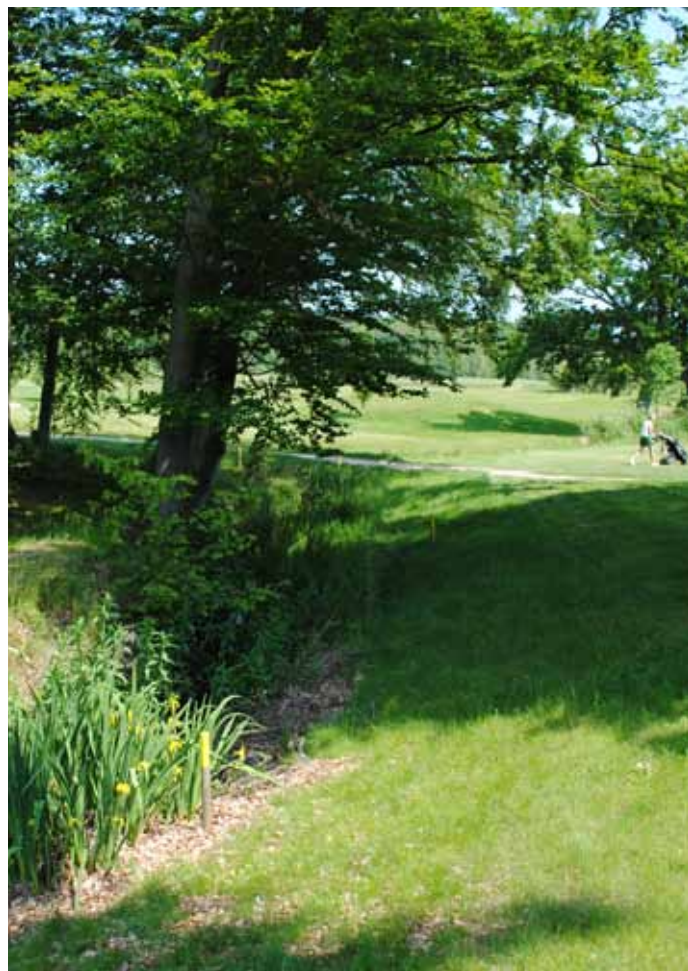
Foto 29. Små bäckar med varierande flora, inklusive växter som lever i vatten, på Hornbæk GK, Danmark.