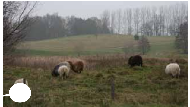
Våtmarksäng som betas av får. Bete är en del i arbetet med att skapa / bibehålla ängsvegetation.