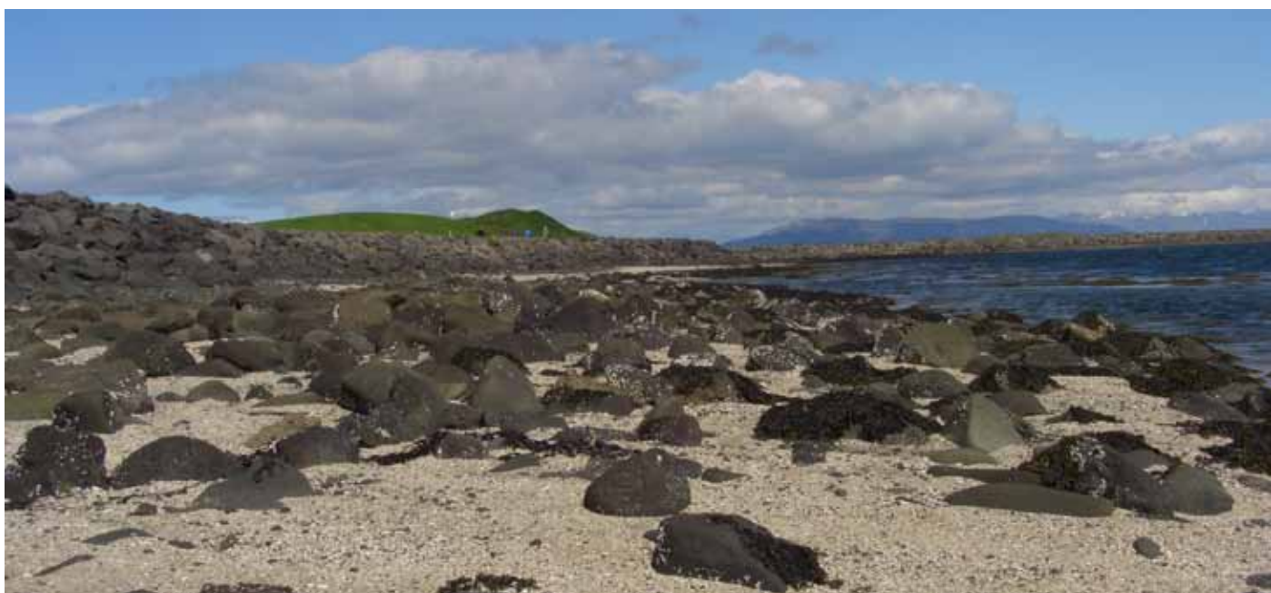
Foto 8. Orörd kustlinje i närheten av Nes GK, Island.

Indikatorer: Orörda kust utan utsikt över bostads- eller industriområden. Här saknas buller och tekniska installationer (kraftledningar, vindkraftverk etc).