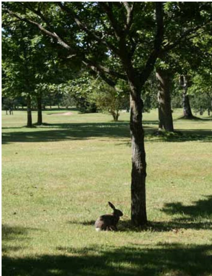
Foto 12. Parkupplevelse på Sydsjællands GK, Danmark.