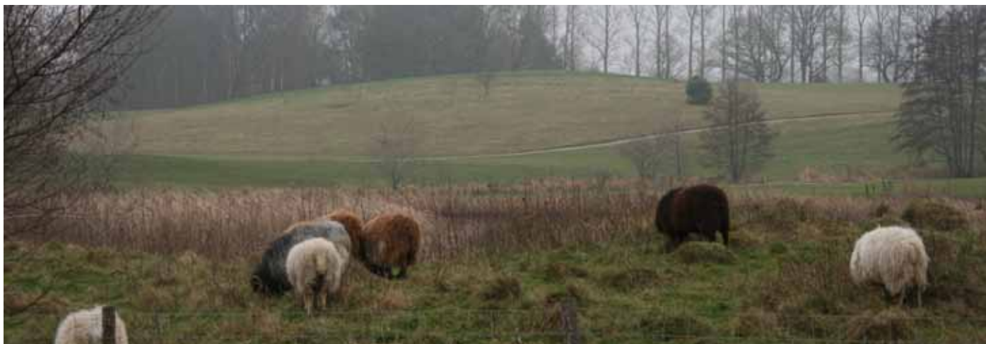
Foto 18. Äng med betande får på Hornbæk GK, Danmark.

Indikatorer: Öppen gräsyta med mycket få spridda grupper av träd, enstaka träd eller buskar. Marken är lämpad för betesdjur. Ofta nära våtmark eller tillfälliga våtmarker. Här saknas skog, sammanhängande buskage, häckar, livligt trafikerade vägar.