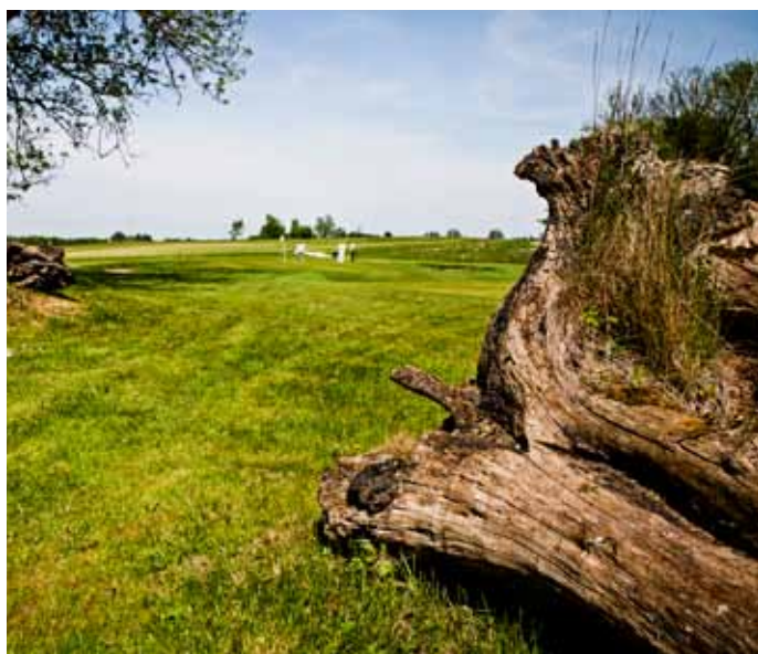
Foto 28. En gammal trädstam som är på väg att ruttna innehåller en hög biologisk mångfald och specialiserade ekosystem. Smørum GK, Danmark.

Indikatorer: Områden med hög (eller medpotential) biologisk mångfald, naturanpassad skötsel, inga gödslade eller besprutade områden. Här används varken gödningsmedel eller bekämpningsmedel.