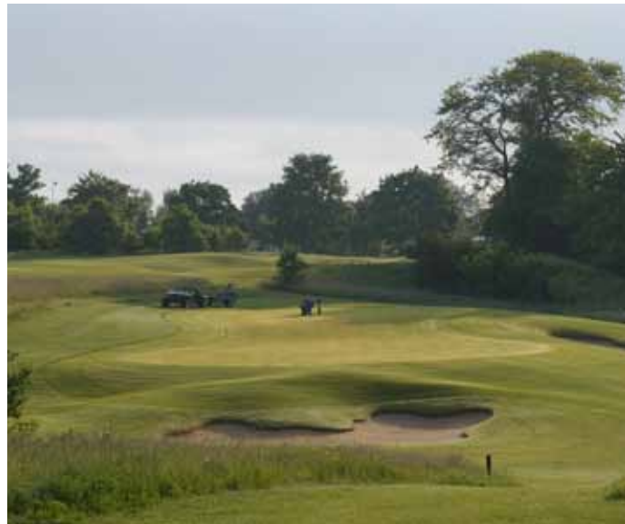
Foto 13. Parkupplevelse på Furesø GK, Danmark.

Indikatorer: Barr eller lövträd, odlad/skött skog med ansad undervegetation, buskage, minimibredd 25 meter. Här saknas tekniska installationer, trafikerade vägar (trafikbuller).