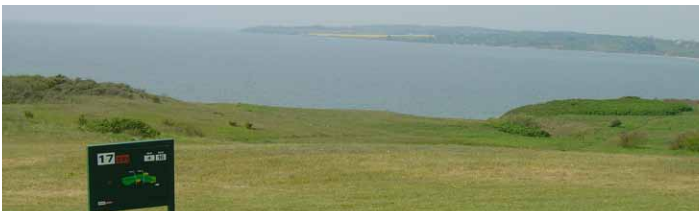
Foto 25. Vackara vyer vid Kattegat från Kalundborg GK, Danmark.