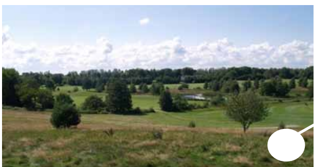
Panoramautsikt över golfbanan, sjön och omgivningar där får betar. Slutningen i närheten är ett område som skyddas enligt dansk naturvårdslag.