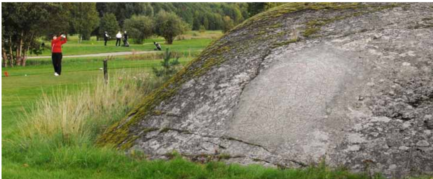
Foto 37. Runristning på Viksjö GK, Sverige.