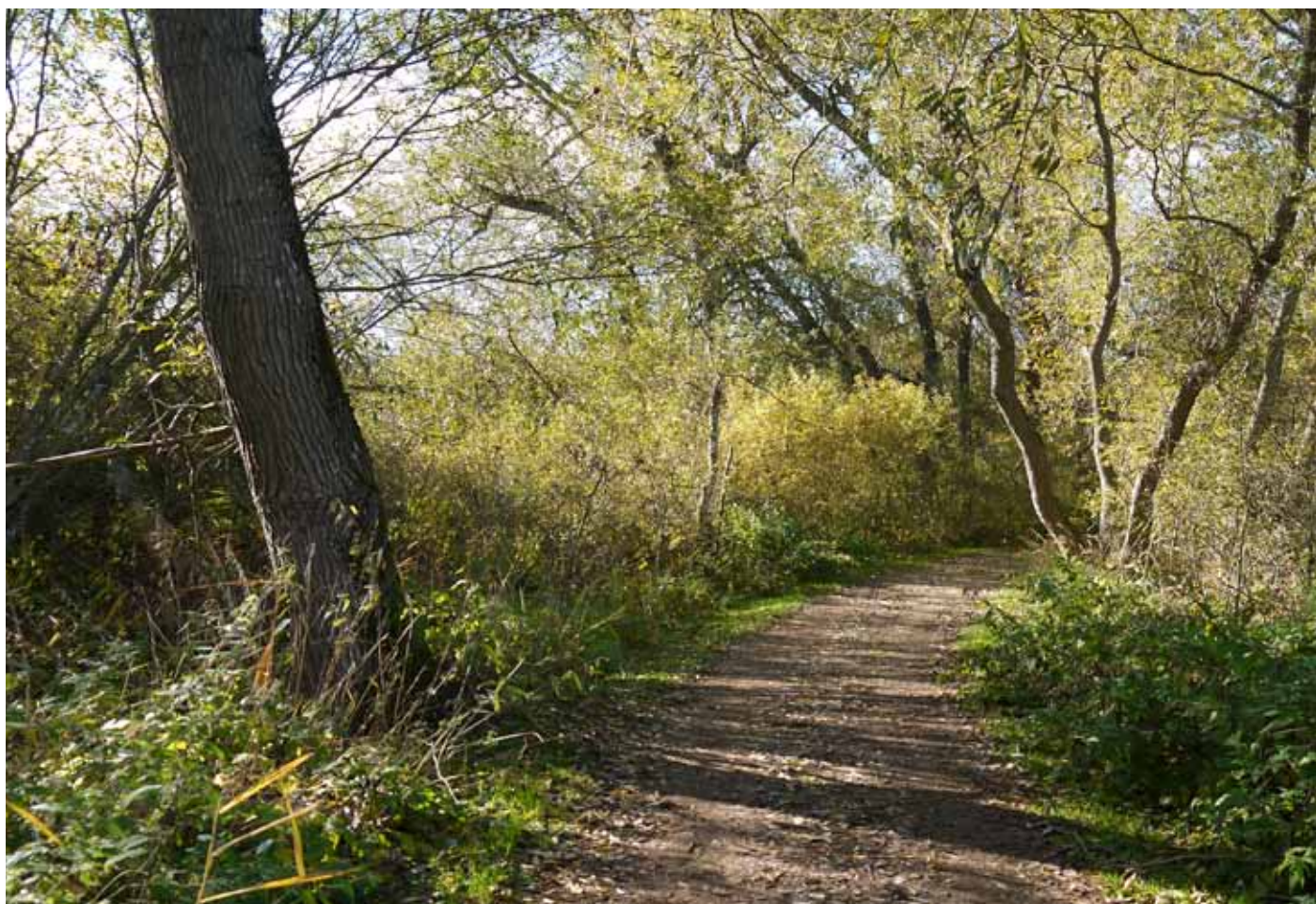
Foto 7. Orörd skog på Sydsjællands GK, Danmark. Alla träd är inhemska och växer vilt. Det enda underhåll som görs är att man röjer så att stigen hålls framkomlig.

Indikatorer: Gamla träd (> 100 år), naturskog (inhemska arter, ingen skogsplantering), myrar och dammar. Här saknas buller och tekniska installationer (kraftledningar, vindkraftverk etc).