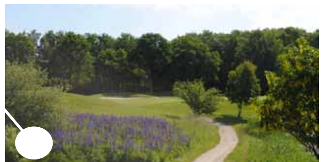
Ruffar där växtligheten sköter sig själv.