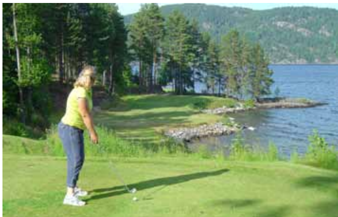
Foto 21. Utsikt över Nordsjö, Nordsjö GK, Norge.

Indikatorer: Potential för utsiktsplats, utsikt över sammanhängande landskap, strandlinjer vid sjö eller hav. Här saknas iögonfallande tekniska installationer.