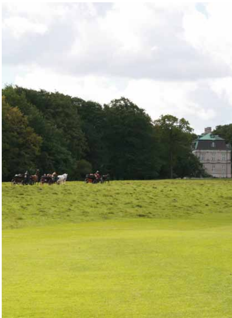
Foto 47. Häst och vagn ekipage på väg genom hjortparken / Köpenhamns GK, Danmark.