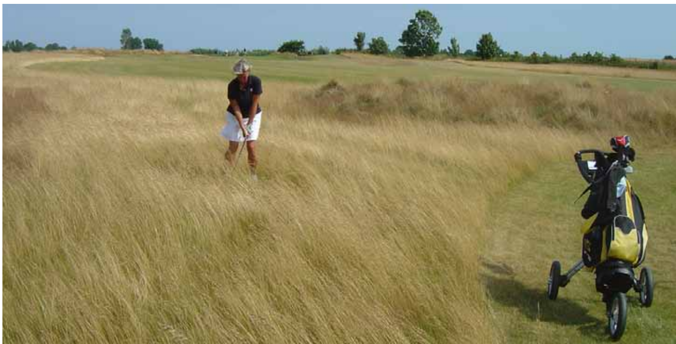
Foto 16. Rödsvingel på gräsmarker på Gyldensten GK, Danmark.

Indikatorer: Arealer som är extensivt skötta, med gräs och / eller örter, spridda träd i grupper eller enskilda träd. Ingen skötsel annat än möjligtvis betande djur. Ingen våtmark. Här saknas även större sammanhängande grupper av träd, häckar och trafikerade vägar.