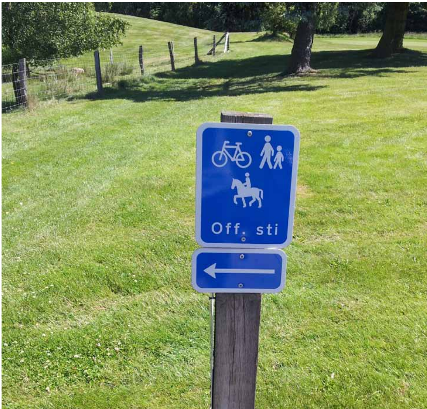
Foto 61. Markerad vandrings-, cykel- och ridstig på Hornbæk GK, Danmark.