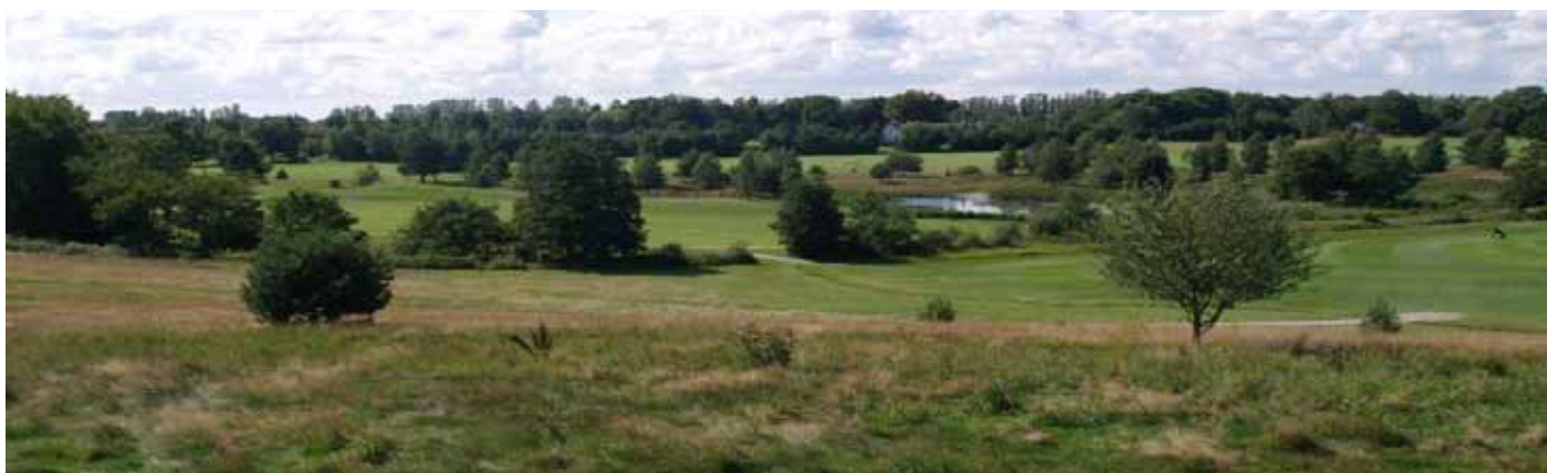
Foto 27. Panorama vy över Hornbæk GK, Danmark. Utsikt från 7:ans tee.