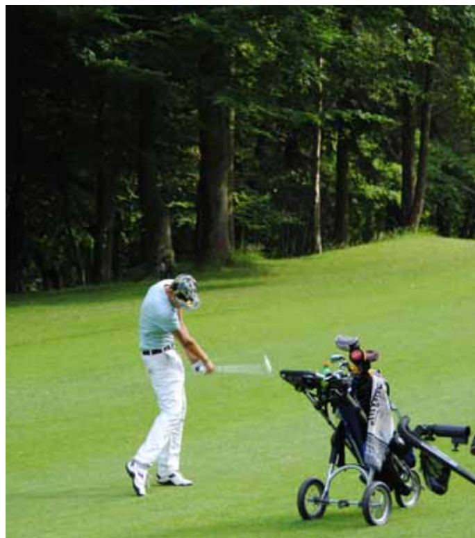
Foto 10. Helsingörs GK, Danmark. Banan omges av naturliga skogsmarker.

Indikatorer: Barr- eller lövträd, vildvuxen skog med undervegetation, minimibredd 25 meter. Här finns inga tekniska installationer, trafikerade vägar (trafikbuller).