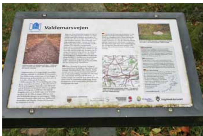
Foto 51. Informationstavla som beskriver den historiska vägen på Skjoldenæsholm GK, Danmark.