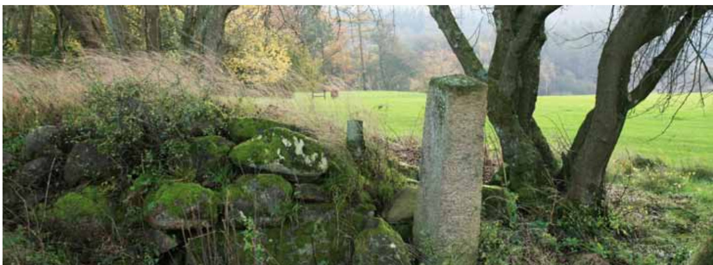
Foto 33. Gammalt stenröse på Skjoldenæsholm GK, Danmark. En utmärkt plats för smådjur och insekter att gömma sig.