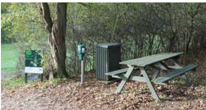
Foto 50. Picnicbord med bänkar på Korsør GK, Danmark.