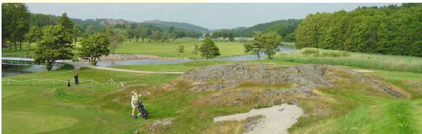
Foto 54. En å på en golfbana är inget säkert område, så att paddla här är ingen bra idé. Fjällbacka GK, Sverige.