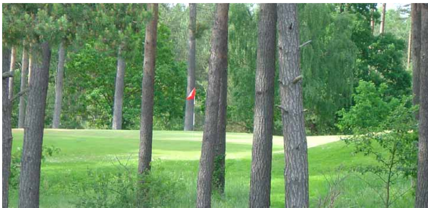
Foto 11. Kristianstads GK, Sverige. Banan omges av tallskog med undervegetation.