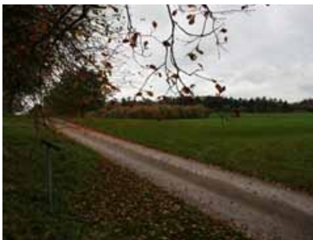
Foto 38. Gammal historisk väg på Skjoldenæsholm GK, Danmark.