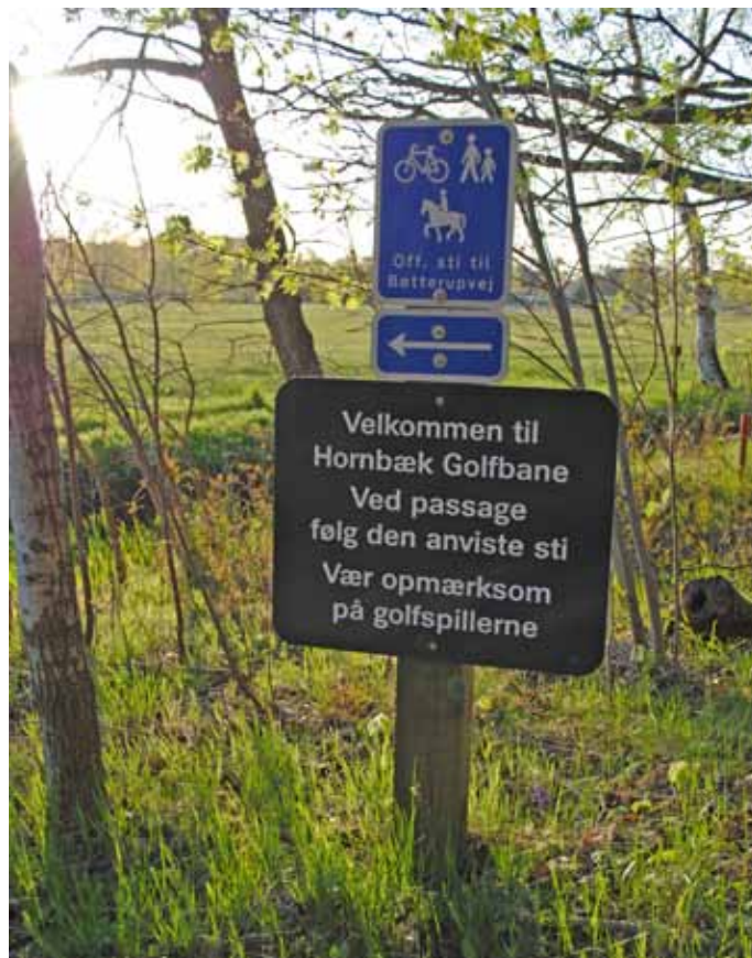
Foto 43. Skyttad gång-, cykel- och ridstig på Hornbæk GK, Danmark.