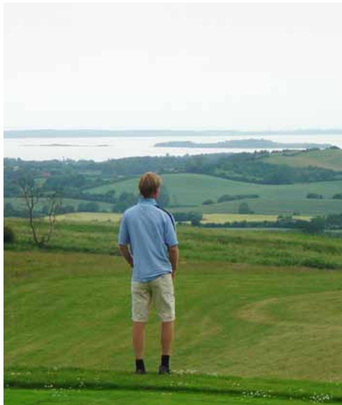
Foto 22. Panoramautsikt över havet och små öar vid Fåborg GK, Danmark.