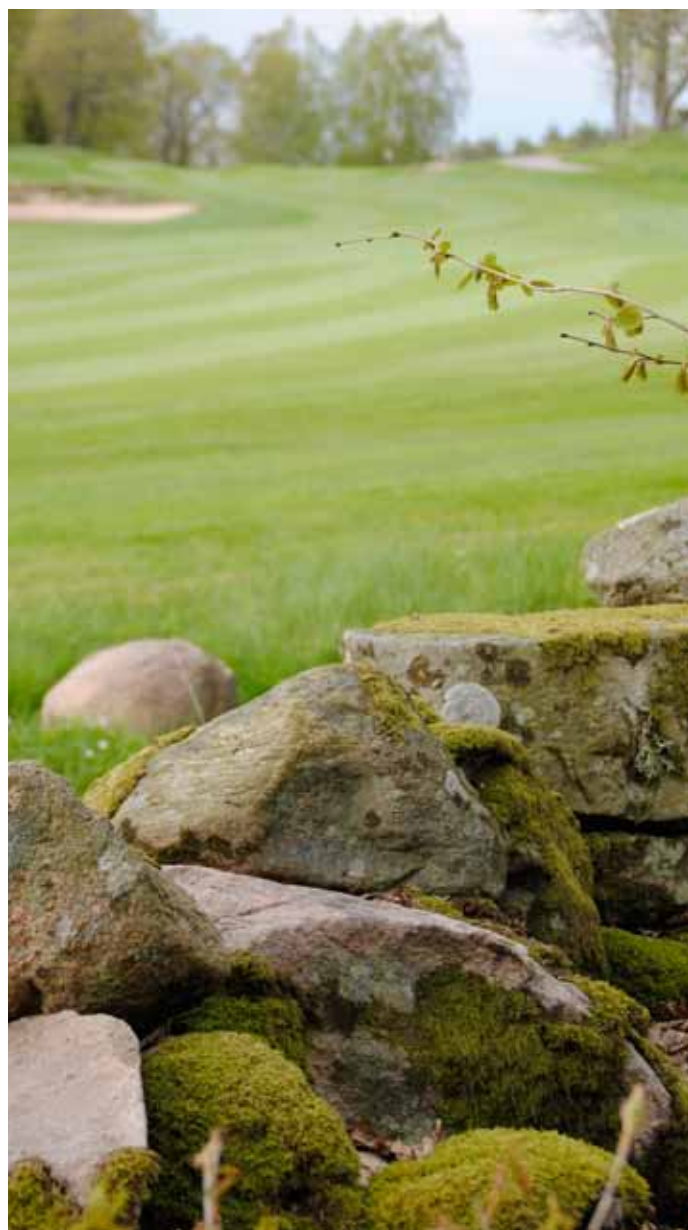
Foto 6. Exempel på kulturhistoria: En gammal stengärdesgård på Gräppås GK, Sverige.

En beskrivning och flera indikatorer finns för varje upplevelsevärde för att underlätta kartläggningen. Indikatorerna består av specifika element eller funktioner som bör finnas (eller saknas) för att beskriva den unika upplevelsen. För vissa upplevelser, krävs att det finns ett specifikt objekt på plats, medan andra upplevelser kräver avsaknad av något; exempelvis trafikbuller, det försämrar upplevelsen av orörd miljö. Vi har illustrerat kategorierna med ett flertal miljöbilder för att underlätta kartläggningen.