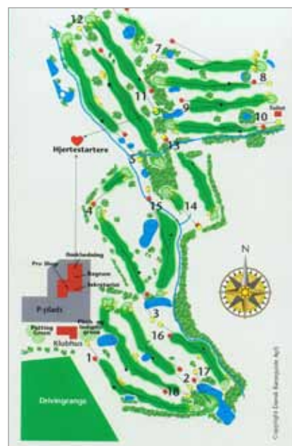
Foto 58. Exempel 3. Kartbild från banguiden

Kartan skrivs ut i 8 exemplar och i stort format – en kopia för varje upplevelsevärde / kategori.