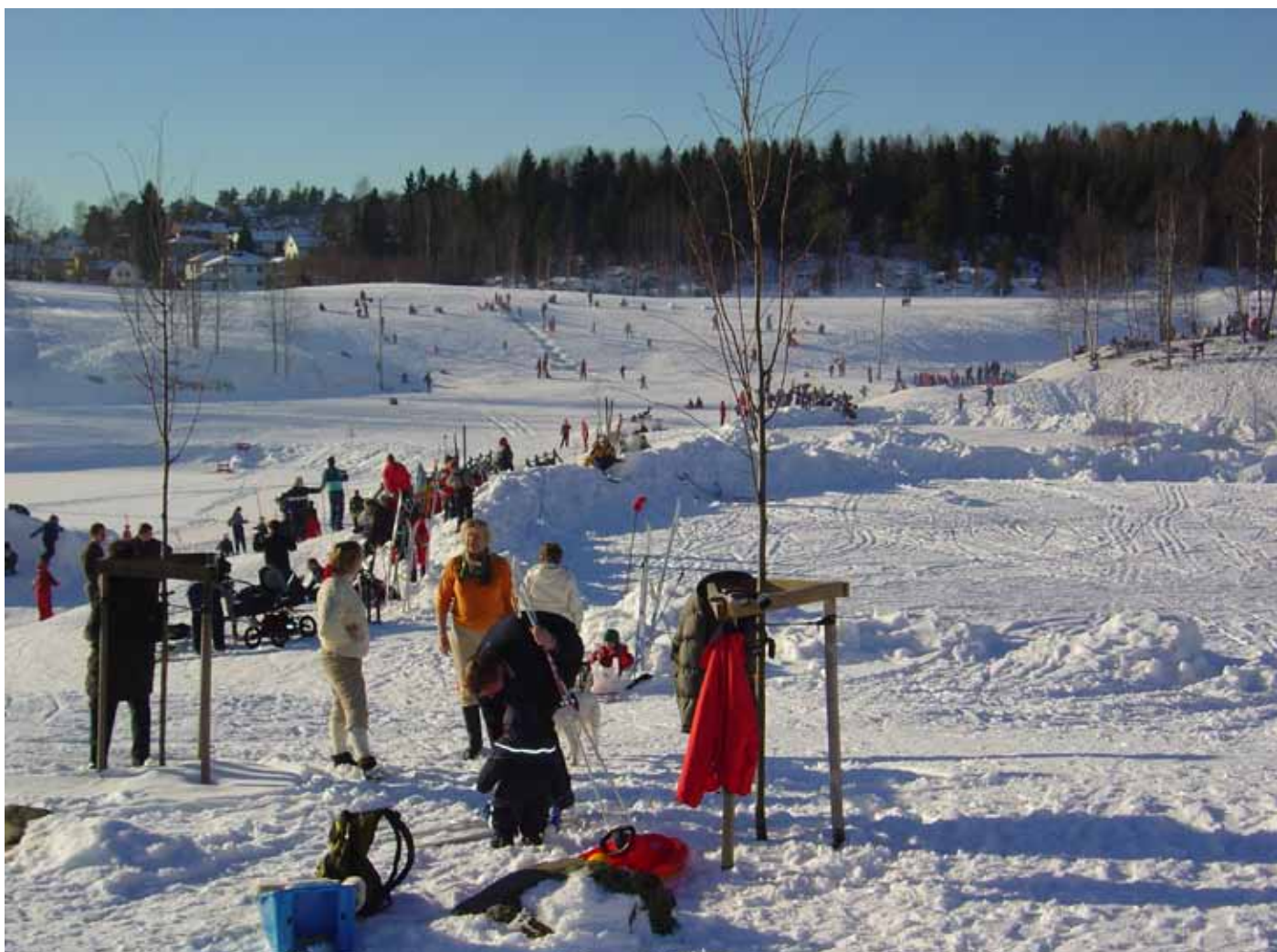
Foto 5. Vinteraktiviteter på Oppgard GK, Norge.