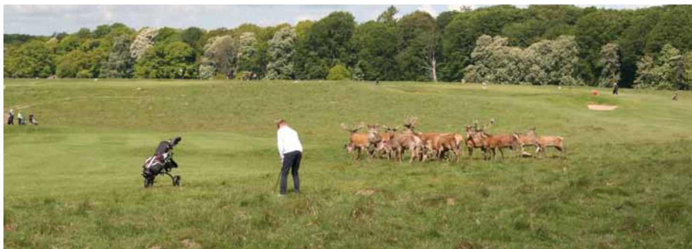
Foto 60. Multifunktionell golfbana i hjorthägnen, Köpenhamns GK, Danmark. De flesta spelarna gillar sällskapet.

Vid problem med säkerheten kan det vara värt att överväga om en potentiell aktivitet kan begränsas till tidsperioder då golfarna inte spelar eller om problemet kan byggas bort.