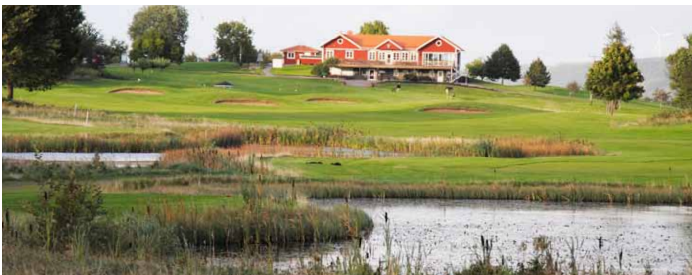
Foto 34. En större damm är ofta ett område med en hög biologisk mångfald. En mängd olika växter och djur kan hittas i vattnet och strandkanten. Gränna GK, Sverige.