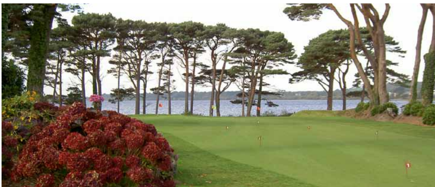
Foto 15. Parkupplevelse på Kileen Golf Course, Irland.