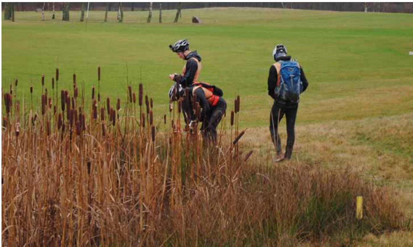
Foto 2. Äventyrslopp på Hornbæk GK, Danmark.