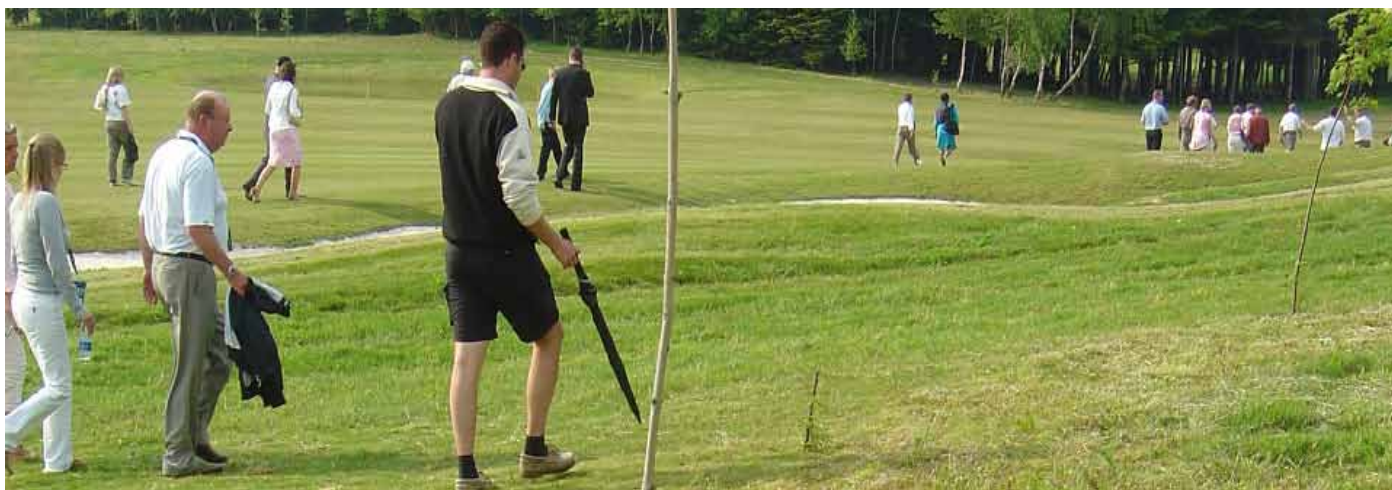
Foto 55. En zon som inte är säker är där man spelar golf. Simons GK, Danmark.