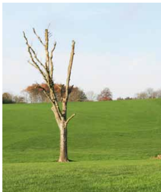
Foto 32. Dött träd på Skjoldenæsholm GK, Danmark. Det är en perfekt livsmiljö för många insekter och svampar.