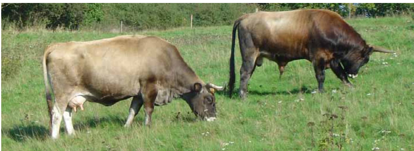
Foto 19. Äng med betande nötkreatur på Smørum GK, Danmark.