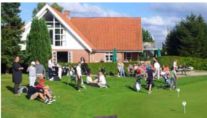
Foto 49. Restaurang på Hornbæk GK, Danmark. Restaurangen erbjuder mat, toaletter etc.