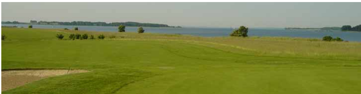
Foto 26. Panorama över Lilla bält, Lillebælt GK, Danmark.