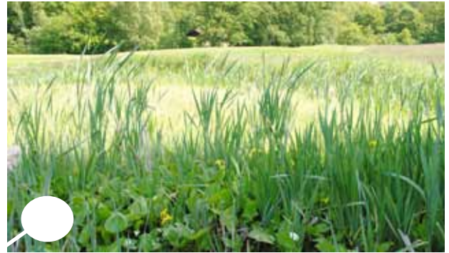
En liten damm med ett xxx.Vegetationen i dessa typer av dammar är xxxx.