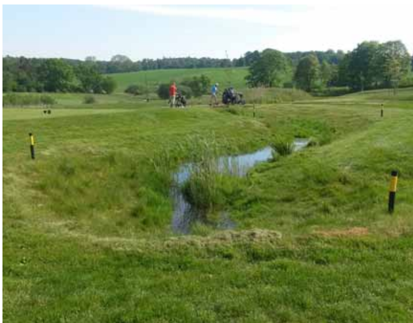
Foto 31. En damm byggd för hantering av dagvatten på Værløse GK, Danmark, kan med tiden bli en utmärkt livsmiljö för flora och fauna.