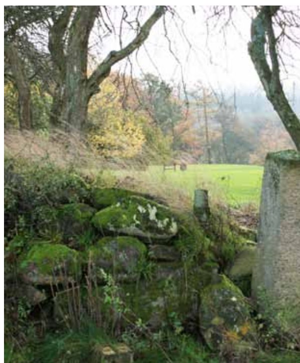
Foto 41. Gammelt stenröse på Skjoldenæsholm GK, Danmark.