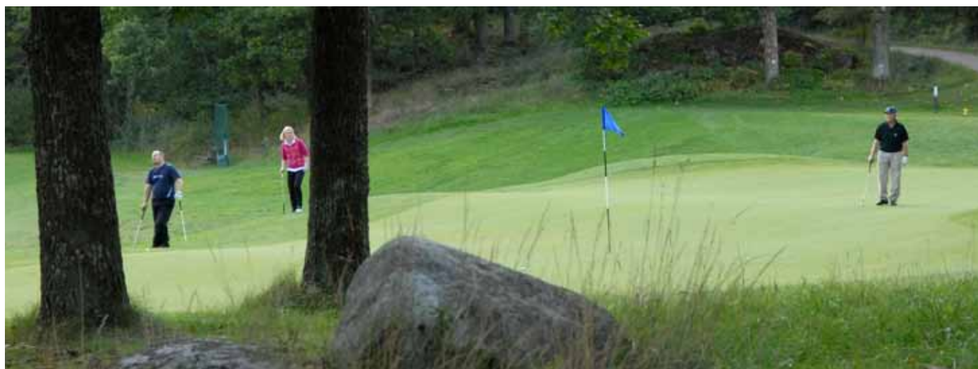
Foto 3. Golfare på greenen på håll 7, Viksjö GK, Sverige.