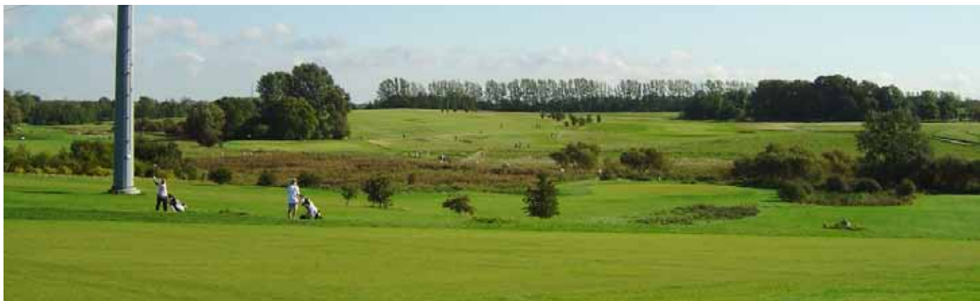
Foto 24 Panorama vid Smørum GK, Danmark.