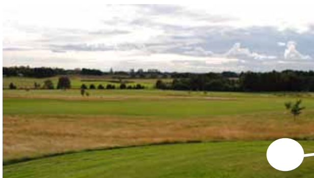
Panoramautsikt från tee, vid hål 7. Utsikt över det mesta av golfbanan och det omgivande jordbrukslandskapet.

Panoramautsikt och Biologisk mångfald (nästa sida) - de vita prickarna på fotografierna visar platsen på kartan.