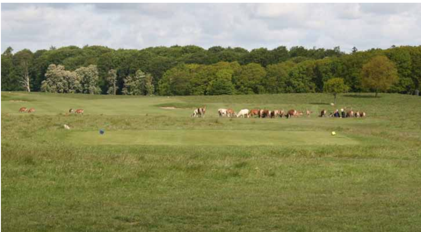
Foto 17. Gräsmarksarealer mellan fairways på Köpenhamns GK, Danmark.