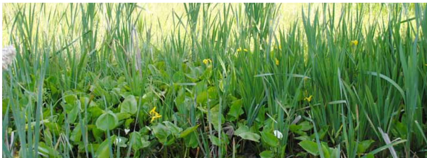
Foto 30. En damm och torvmosse. Här växer bl a Kalla. Hornbæk GK, Danmark.