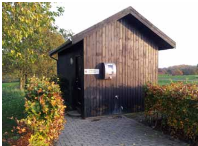
Foto 53. Toalett på Skjoldenæsholm GK, Danmark.