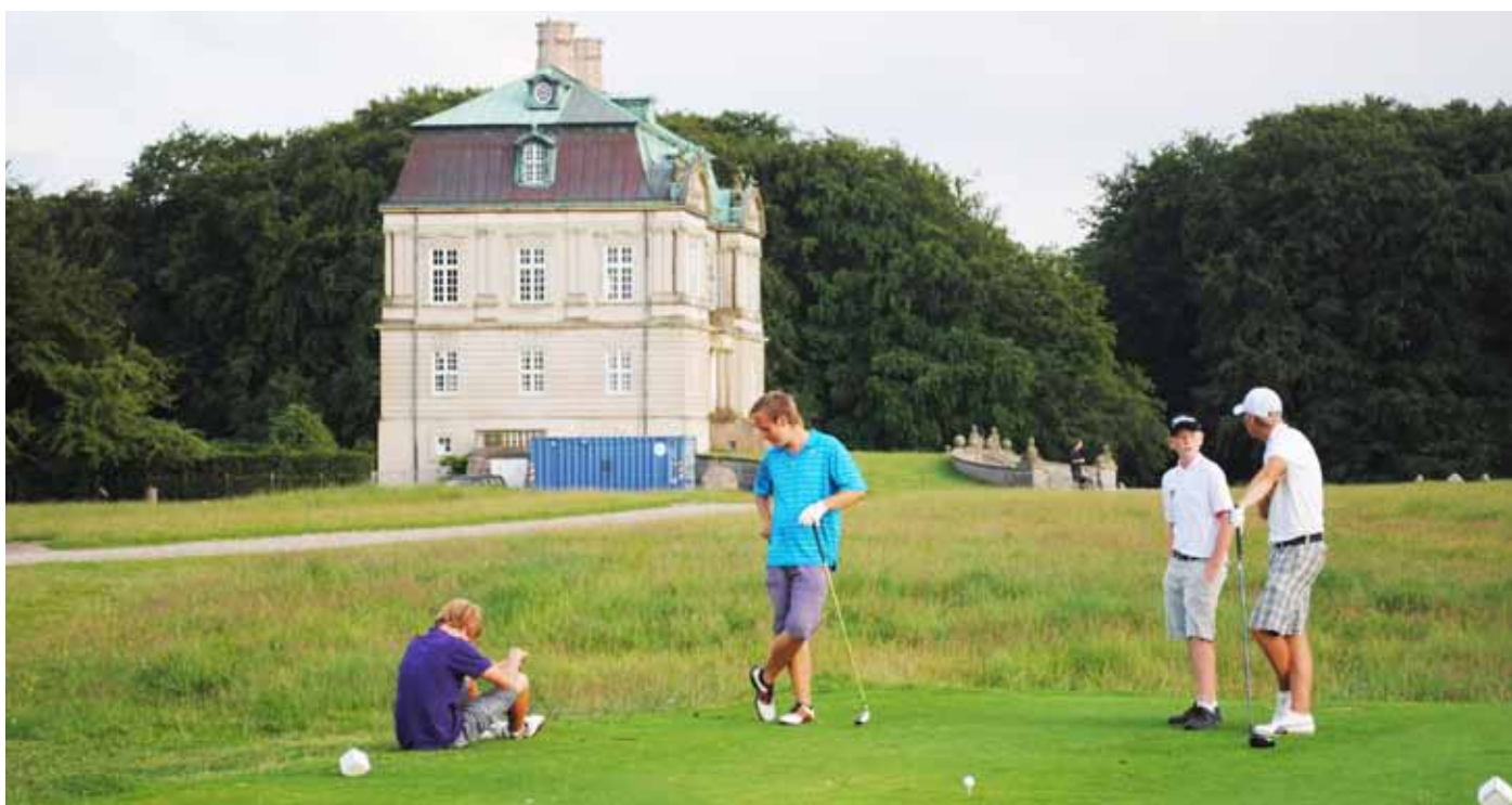
Foto 35. Det gamla jaktlottet i hjortparken / Köpenhamns GK, Danmark.

Indikatorer: Fysiska, kulturhistoriska inslag och områden. Hus, kyrkor, gravrösen, sten och jordvallar, historiska vägar. Här saknas moderna tekniska installationer.