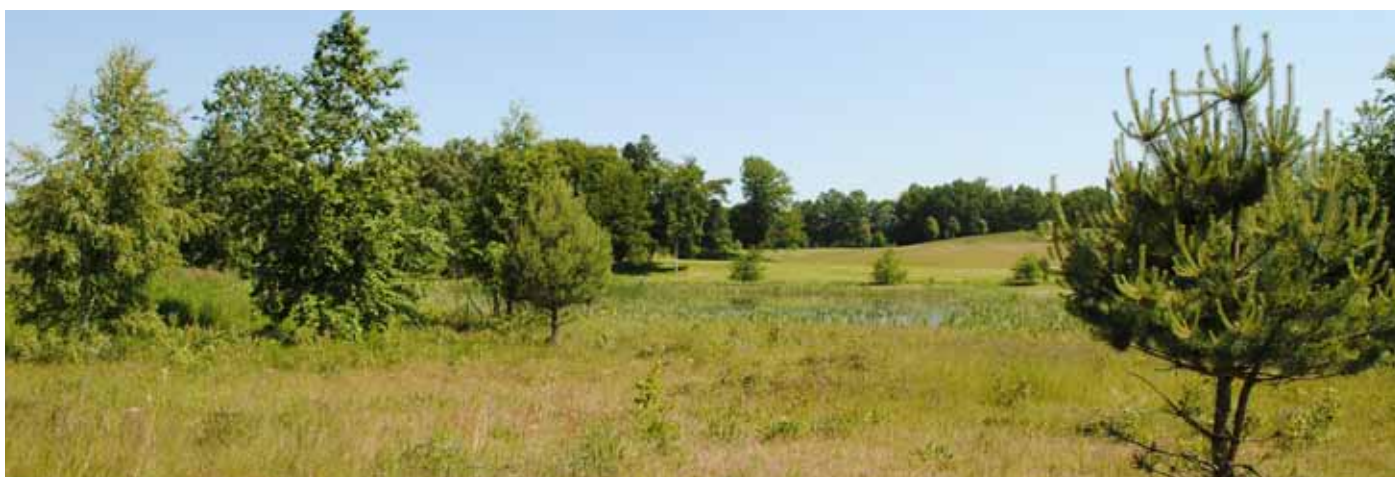
Foto 20. Våtmarksäng på Hornbæk GK, Danmark.