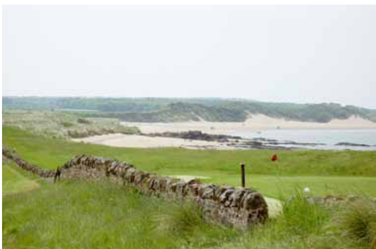
Foto 39. Det berömda 13:e hålet på West Links GK, Skottland, där greenen ligger bakom den gamla stenvuren.