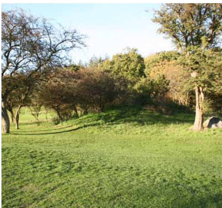
Foto 40. Lämningar av en gravhög på Korsør GK, Danmark.