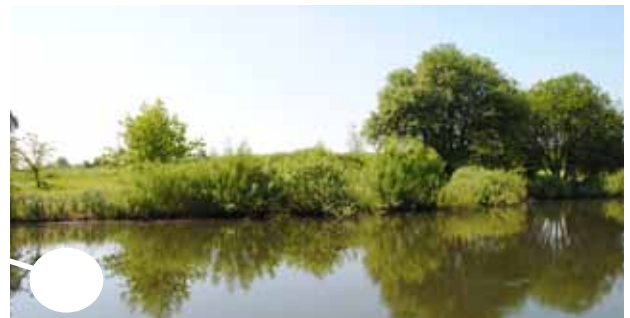
Damm på håll 15, som förr var ett grustag.Vegetationen runt dammen är mycket varierande.Vattendjupet gör det möjligt att få en unik flora och fauna.