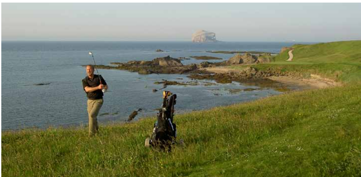
Foto 9. Orörd kust vid The Glen Golf Course, Skottland.