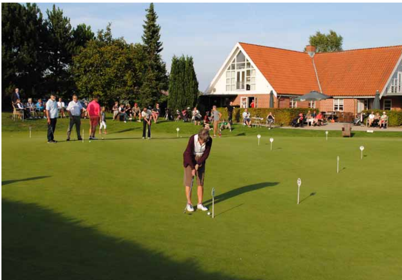
Foto 4. Social samvaro på Hornbæk GK, Danmark.