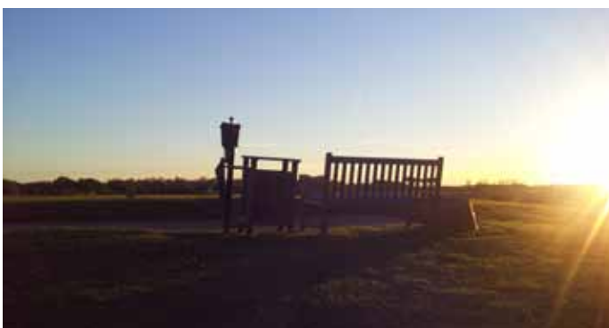
Foto 48. Bänk och soptunna på håll 7, Hornbæk GK, Danmark.

Indikatorer: Parkeringsplatser, bushållplats, informationstavlor och andra faciliteter som toaletter, bänkar, picnic-bord, soptunnor, lägereldsplats, fågeltorn, lekplats, restaurang, kiosk, camping, övernattningsmöjligheter.