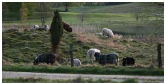
Lampaat laiduntavat Hornbækin golfkentällä Tanskassa.

Muutamille golfkentille Tanskassa ja Ruotsissa on tuotu laiduntavia eläimiä torjumaan rikkakasveja. Tämä saattaa olla varteenotettava ratkaisu, sillä lähes 70 % kyselyyn vastanneista golfin pelaajista hyväksyisi eläinten laiduntamisen karheikkoalueilla.