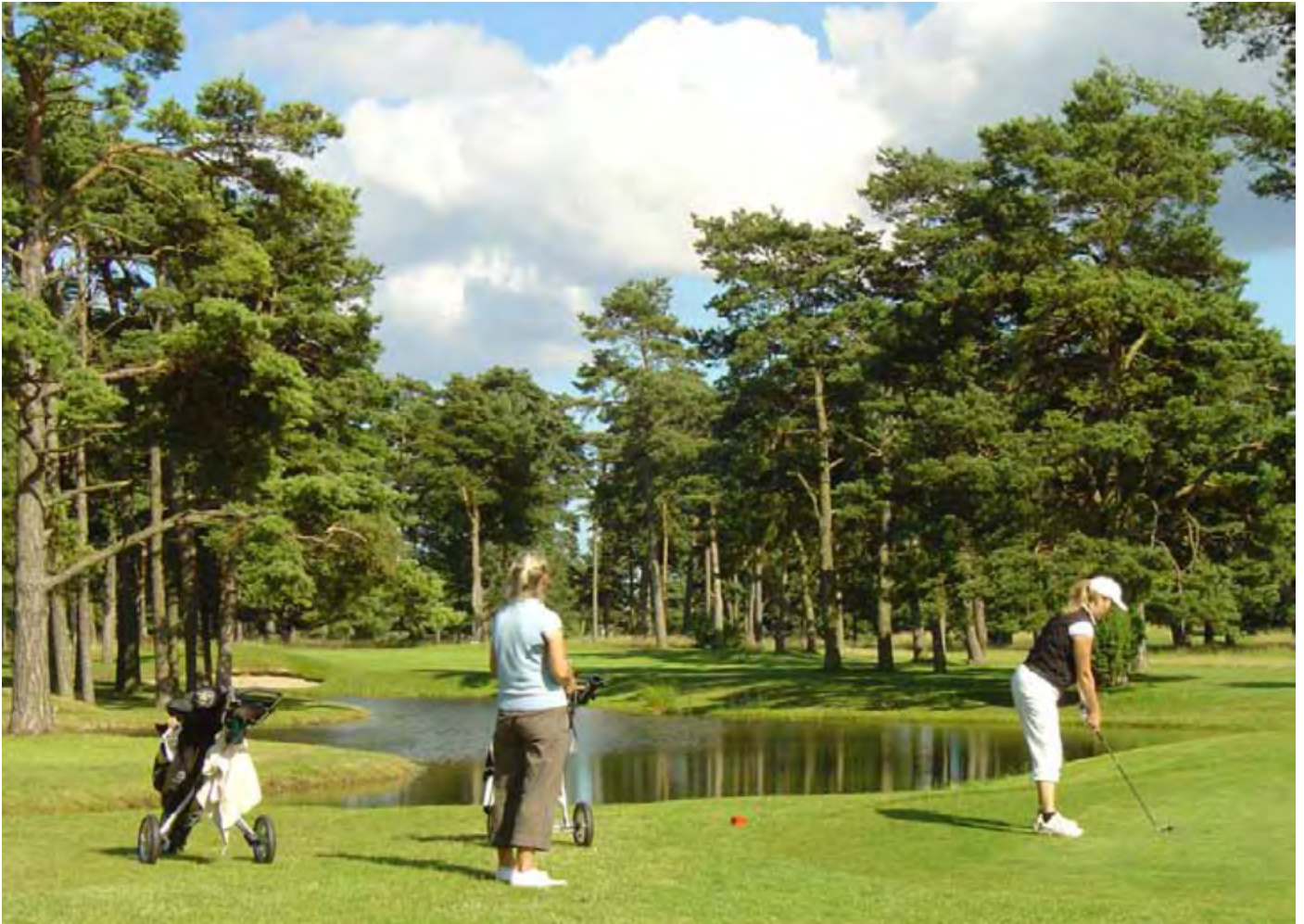
Avauslyönti tiiauspaikalta Kristianstadin golfkentällä Ruotsissa.