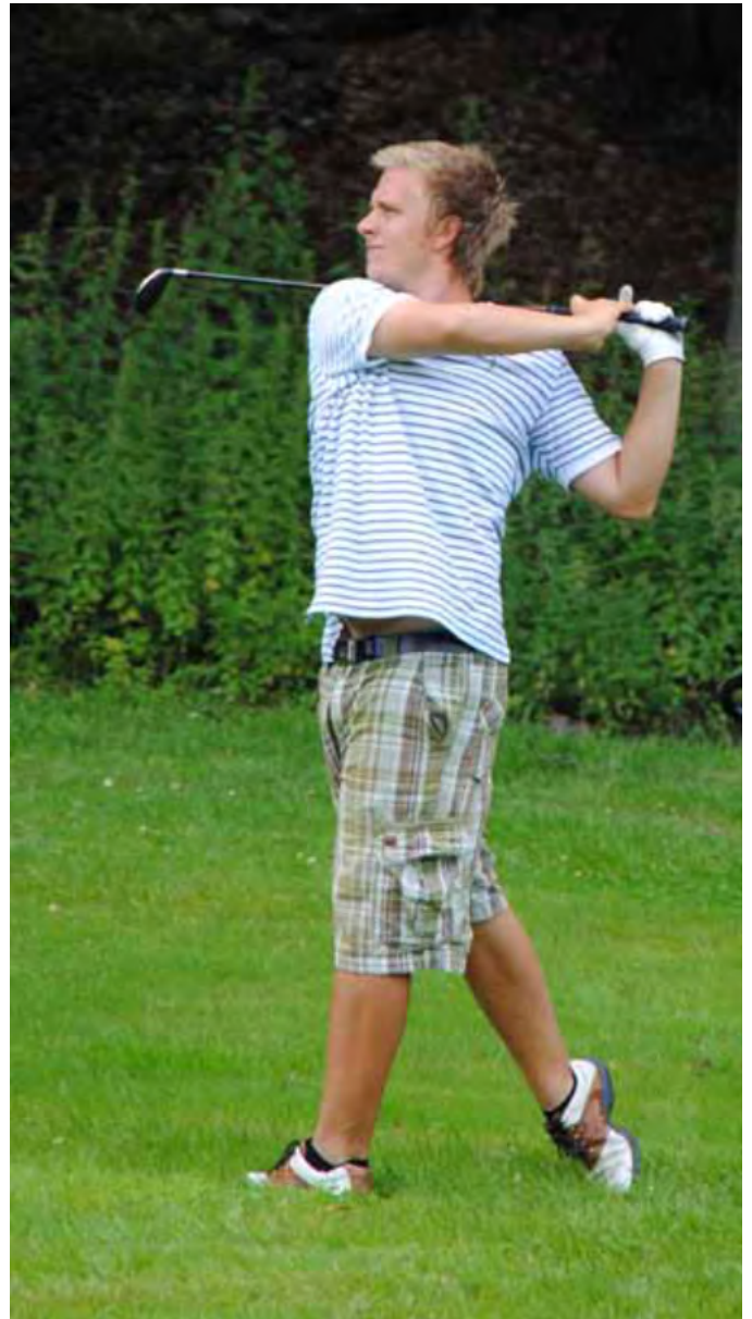
Jokainen golfin pelaaja näkee pelaamisen laadun ainutlaatuisella tavalla, ja sen määrittelevät monet erilaiset tekijät kentällä.

Koko projektiraportti on ladattavissa STERF:n verkkosivuilta sterf.golf.se .