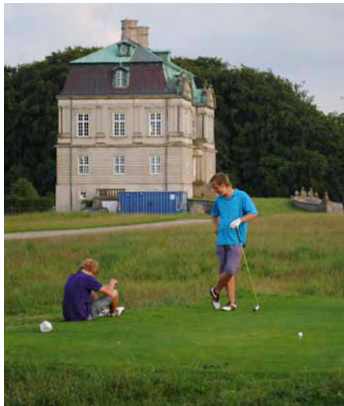
Tiiauspaikka Kööpenhaminan golfkentällä.

Siksi tiiauspaikkojen on oltava suhteellisen suuria, jotta pelaajat voivat nauttia tasaisista pelipinnasta koko kauden ajan.