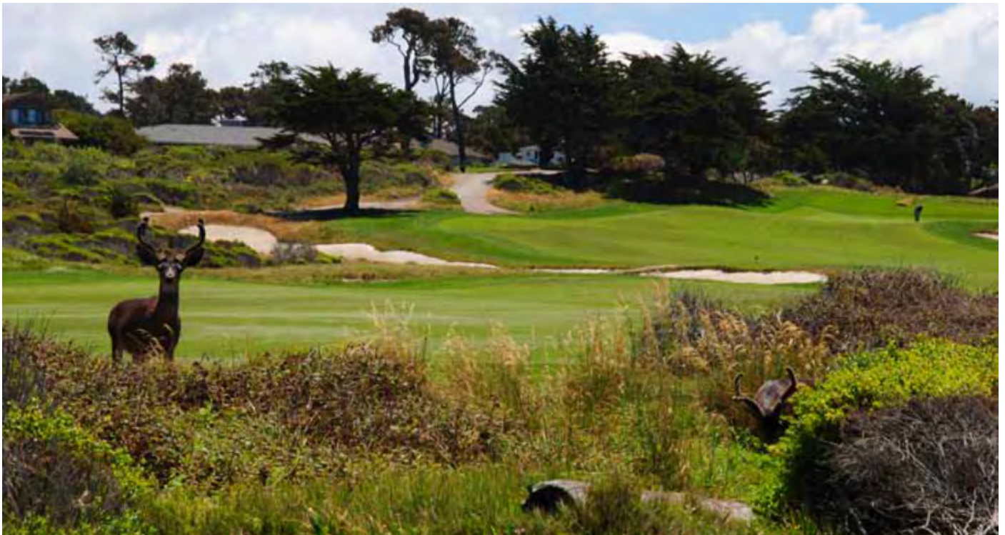
Hyvän golfkokemuksen kannalta tärkein tekijä on luontokokemus. Monterey Peninsula Dunes -golfkenttä, Yhdysvallat.

Tämä kysely paljasti myös, että hyvän golfkokemuksen kannalta tärkein tekijä on luontokokemus. Siksi kentän hoidossa tulisi keskittyä sekä yksityiskohtaisesti jokaiseen kentän osatekijään että, myös yleisemmin luontoarvojen vahvistamiseen golfkentällä.