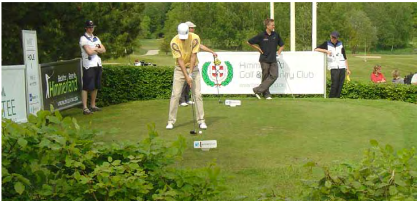
Eniten tiiauspaikkojen peliin vaikuttava tekijä on alueen tasaisuus. Hornbækin golfkenttä, Tanska.