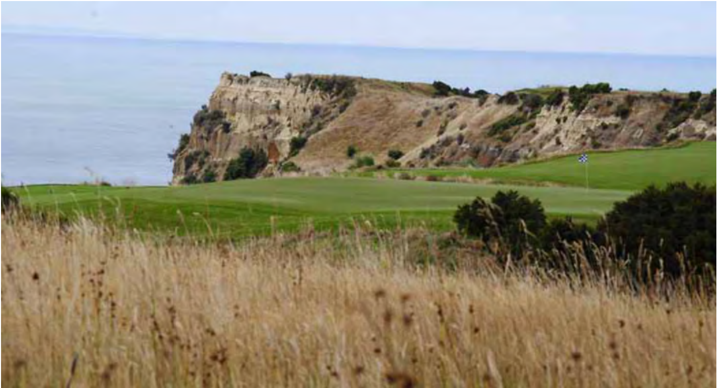
Luontokokemuksella yhdistettynä kentän suunnitteluun on suurin vaikutus golfskokemukseen. Cape Kidnappers, NZ.