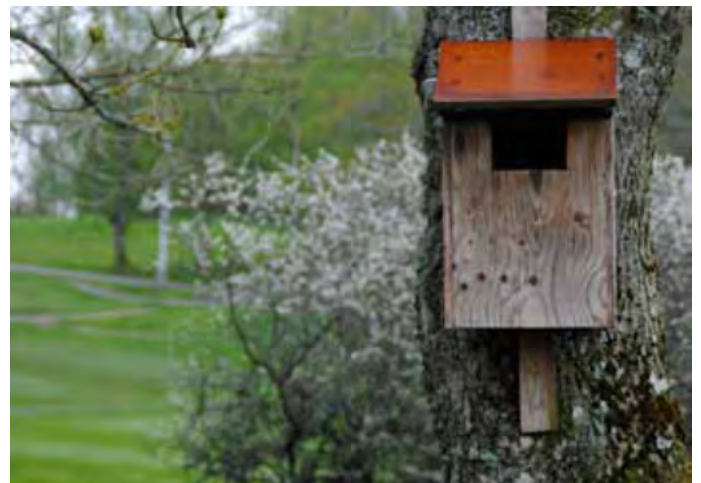
Linnunpönttö. Gräppåsin golfkenttä, Ruotsi.

Nyt keskustellaan siitä, voidaanko GEO-sertifiointia käyttää markkinointivälineenä golfin pelaajien houkuttelemiseksi. Tämän tutkimuksen tulokset näyttävät osoittavan, ettei GEO-sertifioinnista ole vahvaksi markkinointityökaluksi pelaajien suuntaan. GEO-sertifiointia on ensisijaisesti haettava, koska klubi/kenttä haluaa sitoutua kestäväan kehitykseen. Kentät voisivat hyötyä enemmän luontoarvojen käyttämisessä markkinoinnissa tai panostamalla luontopääomansa parantamiseen.