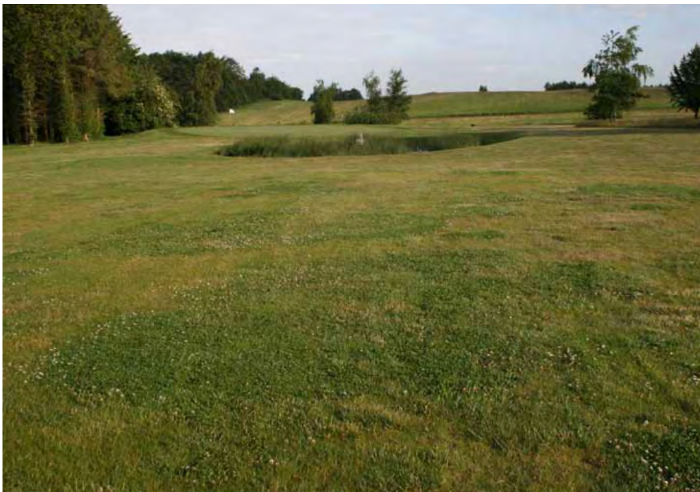
Golfkentän tuholaisia ovat sienet, hyönteiset ja rikkakasvit. Golfin pelaajat sietävät vähiten rikkaruohoja. Lillebæltin golfkenttä, Tanska.