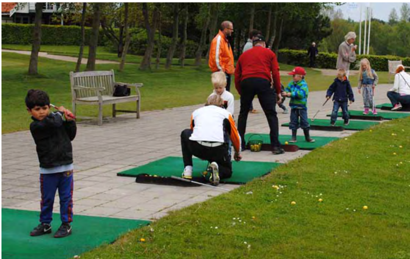
Harjoituslyöntialue Hornbækin golfkentällä Tanskassa.