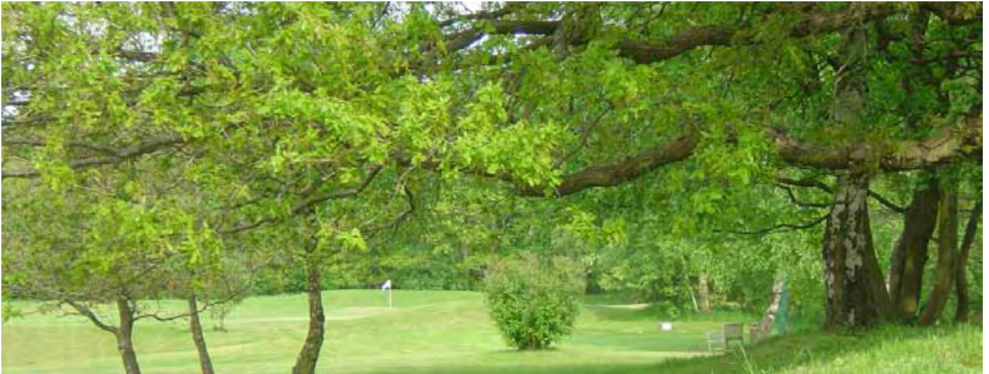
Kestävä kehityksen mukainen kentänhoito on tärkeämpää Tanskan ja Ruotsin pelaajille kuin pelaajille Suomessa ja Norjassa. Hornbækin golfkenttä, Tanska.