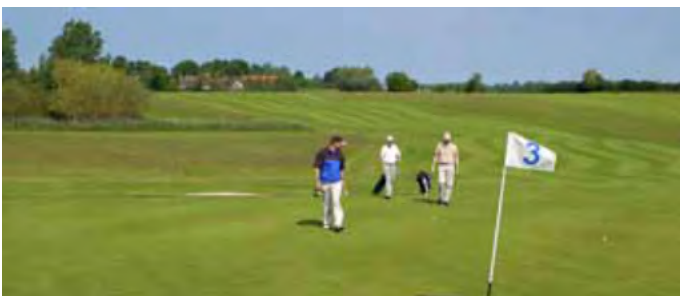
Kansikuva: Valløn golfkenttä, Tanska.