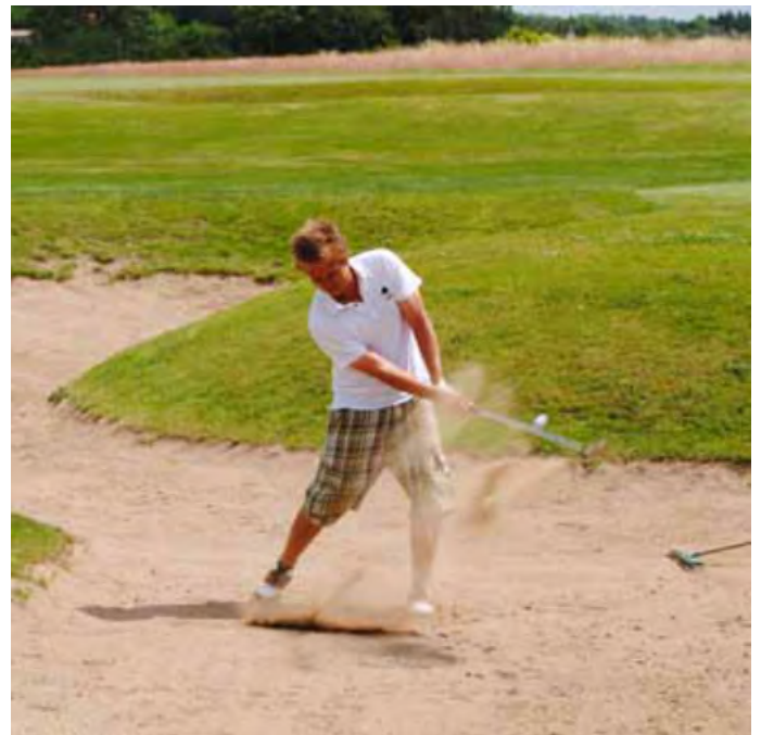
Bunkkerilyönti Mølleåenin golfkentällä Tanskassa.

Siksi golfseurojen on kiinnitettävä enemmän huomiota bunkkerien rakentamiseen ja kunnossapitoon, ja estettävä ruohon ja rikkakasvien kasvaminen bunkkereissa, koska pelaajat eivät pidä siitä.