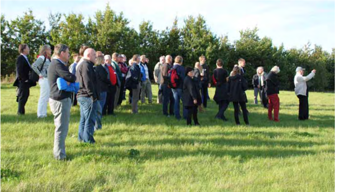
Tapaaminen Smörumin golfkeskuksessa, Tanskassa.