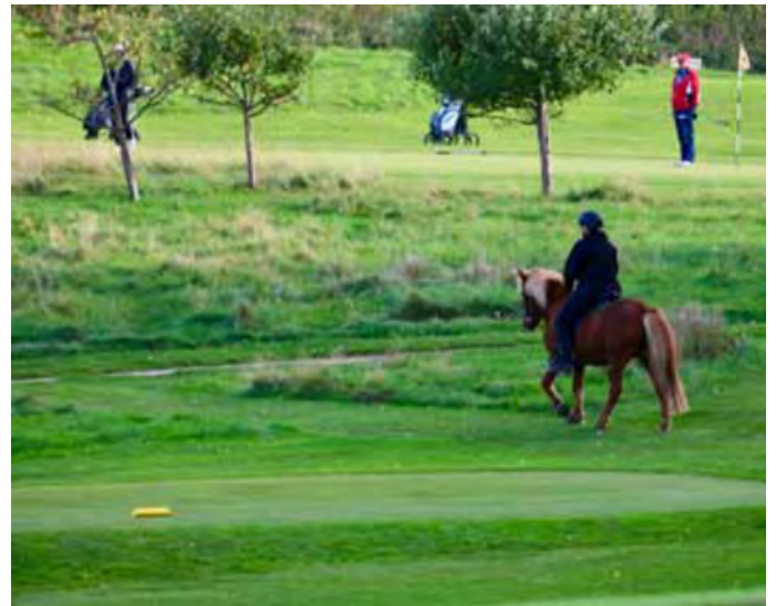
Ratsastusta polulla, joka on turvallisesti erotettu pelialueesta. Asserbon golfkenttä, Tanska.