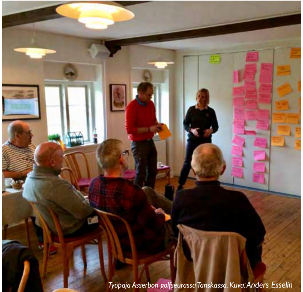
Työpaja Asserbon golfseurassa Tanskassa.

Yhdistyneiden kansakuntien kestävä kehityksen toimintaohjelma, Agenda 2030, hyväksyttiin vuonna 2015. Ohjelmassa on 17 kestävä kehityksen tavoitetta (SDG) ja 169 alatavoitetta, jotka kattavat laajan kirjon ihmiskunnan hyvinvoinnille tärkeitä kehityskysymyksiä. Vaikka haasteet ovat globaaleja, ratkaisut ovat pääosin paikallisia.