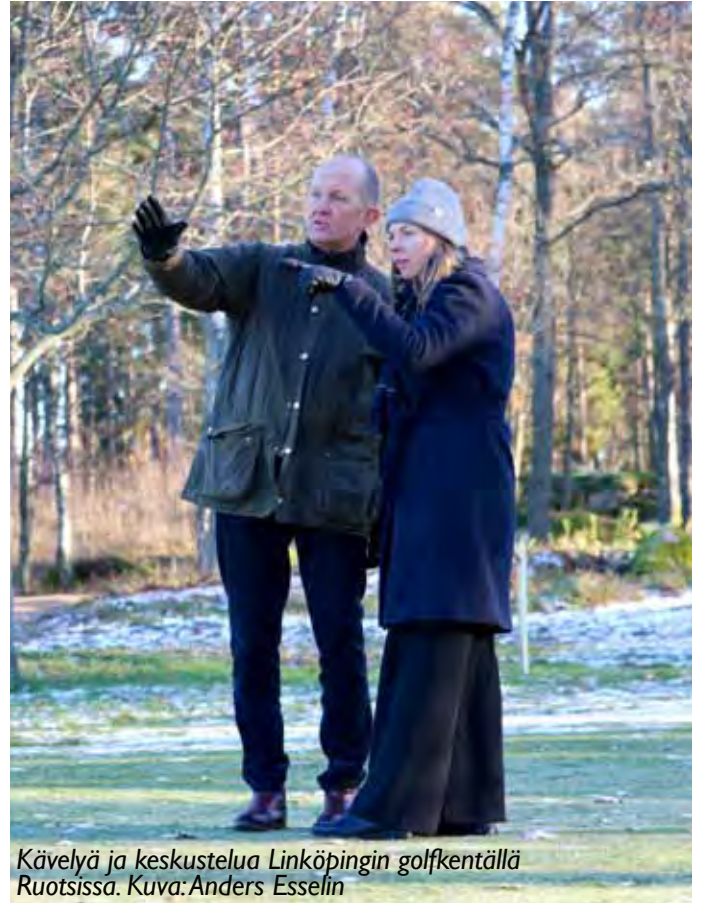
Kävelyä ja keskustelua Linköpingin golfkentällä Ruotsissa.