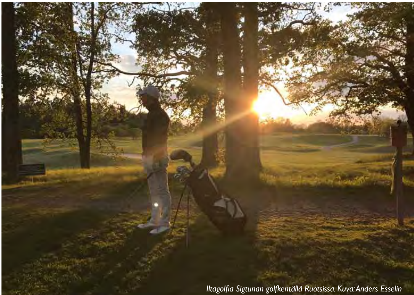
Iltagolfia Sigtunan golfkentällä Ruotsissa.