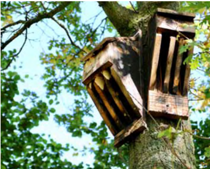
Lepakköpönttöjä Asserbon golfkentällä Tanskassa.