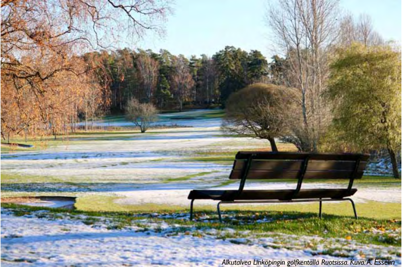
Alkutatvea Linköpingin golfkentällä Ruotsissa.