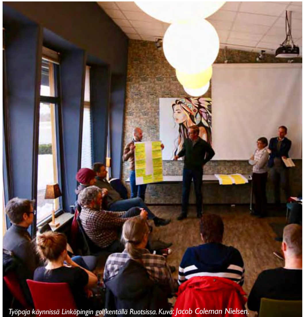
Työpaja käynnissä Linköpingin golfkentällä Ruotsissa.