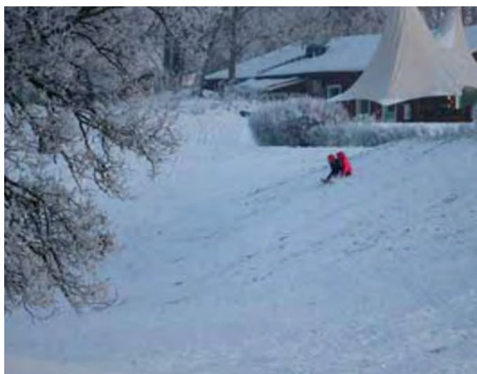
Pulkkamässä Sigtunan golfkentällä Ruotsissa.