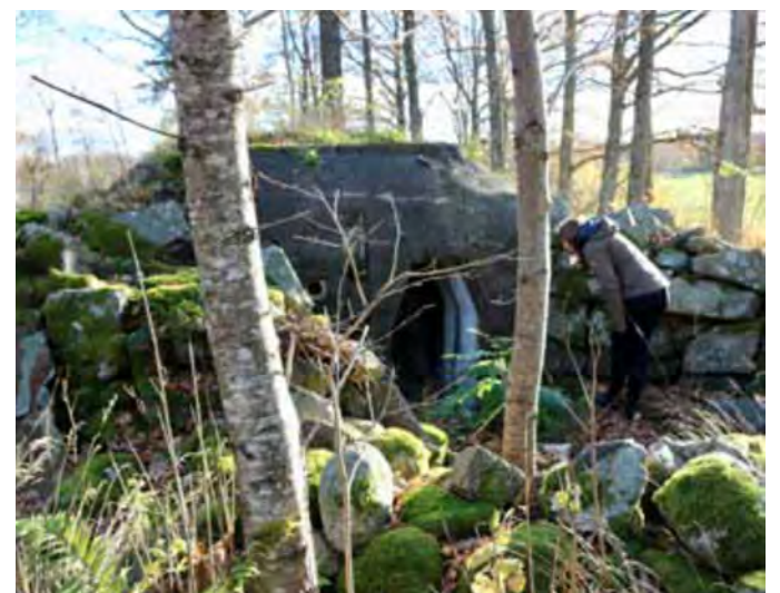
Toisen maailmansodan aikainen saksalainen bunkkeri Larvikin golfkentällä Norjassa.