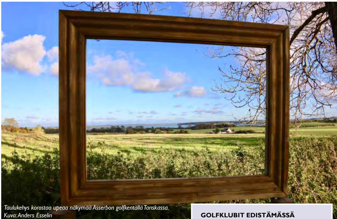
Taulukehys korostaa upeaa näkymää Asserbon golfkentällä Tanskassa.