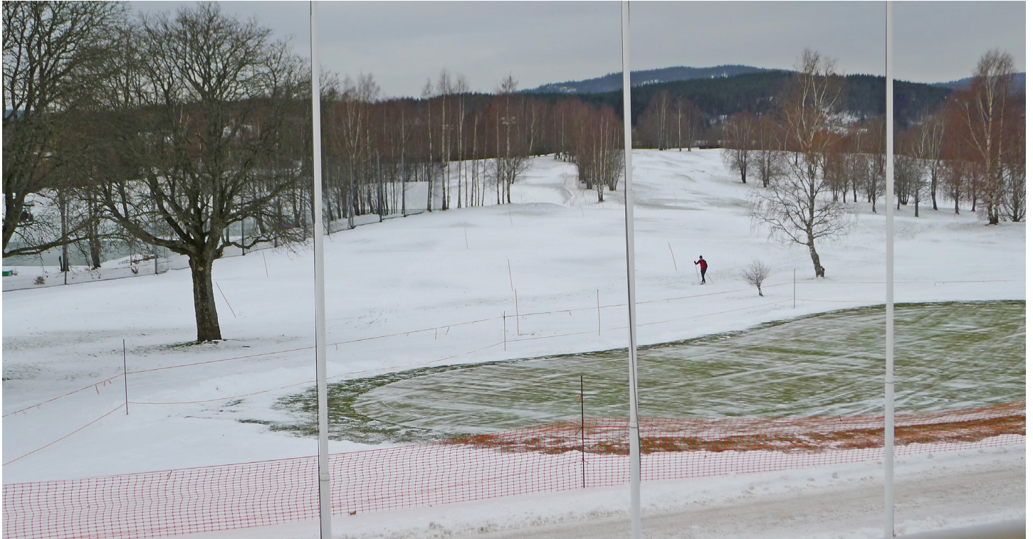
Fjerning av den første snøen når det er nødvendig for å få tele i greenene, er vanlig praksis på Oslo golfklubb. Legg også merke til skiløperen som har forstått at golfbaner gir perfekte forhold når snølaget er svært tynt.

Den gressarten som bruker lengst tid på å komme ut av herdet tilstand er rødsvingel med korte utløpere ( Festuca rubra ssp litoralis (=ssp trichophylla )). Hundekvein ( A.canina ) blir også avherdet langsomt, og av denne grunn er den i praksis regnet som like vintersterk som krypkvein.