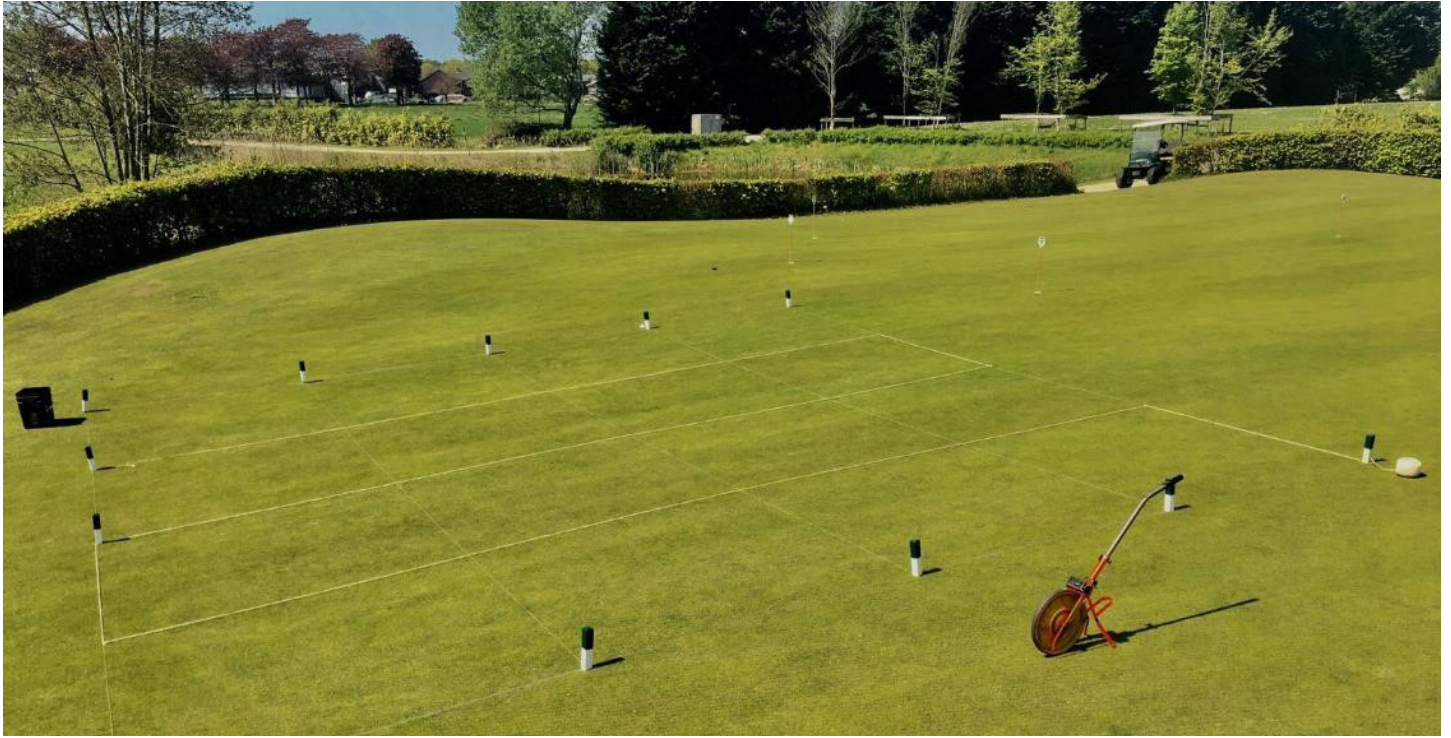
Foto 2: Green af rødsvingel og alm. hvene (Gødet med ca. 50 kg N/ha) på Princenbosch GC i Holland blev opdelt i 2x2 meter felter, som blev tildelt forskellige mængder af fosfor gennem fire år.

november, rodlængden og andel af sygdomme og enårig rapgræs blev også registreret. I november hvert år blev der taget jordbundsanalyser af alle felter, og tallene her blev brugt som udgangspunkt for tildeling af fosforgødning i behandling nummer 2 og 4 året efter (Tabel 1).