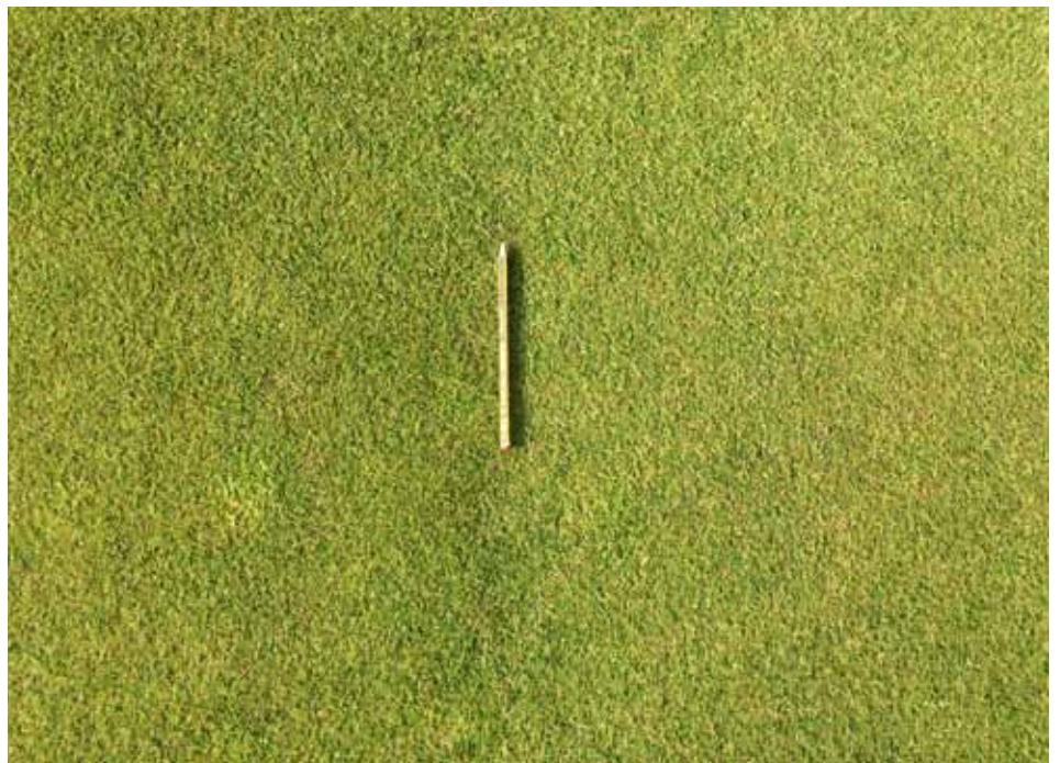
Bilde 3. Ruter med krypkvein-skjøtsel på Landvik. Rødsvingel + engkvein til høyre (med innslag av tunrapp) og rødsvingel + krypkvein til høyre.

At dette også gjelder når de to artene kombineres med rødsvingel ble i disse forsøka sikkert bekreftet for microdochium-flekk (tabell 2).