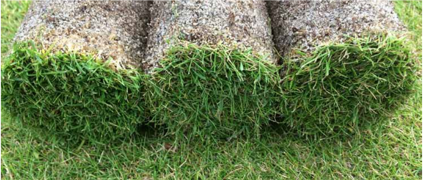
Bilde 2. Prøver fra blandingsgreener med rødsvingel + hundekvein (til venstre), rødsvingel + krypkvein (i midten) og rødsvingel + engkvein (til høyre), gjødslet og klipt som rødsvingel på Landvik. Legg merke til større skudtetthet og mer opprett vekst, men også mer filt, ved rødsvingel + hundekvein enn ved de andre kombinasjonene.

skudtetthet, men også med større fildannelse (bilde 2) enn rutene med rødsvingel + krypkvein og rødsvingel + engkvein. Hvis noen ønsker å prøve rødsvingel + hundekvein, bør nok gjødselmengden reduseres under de 1.0 kg N/100 m 2 som ble gitt i disse forsøka. En annen god ide kan være å redusere andelen hundekvein betydelig under de de 10 % som vi brukte, kanskje helt med mot 1 %. Dette praktiseres med godt resultat av sjefsgreenkeeper Thomas Pihl på Furesø GK utenfor København.