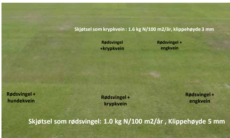
Bilde 1. Femten måneder gamle blandingsgreener med rødsvingel og ulike kveinarter stelt som rødsvingel eller krypkvein. Bilde tatt på Landvik i september 2016.

litet) og en rekke andre karakterer bedømt en gang pr måned gjennom vekstsesongen, fra såing i 2015 til siste bedømming i 2018 (tredje greenår). På grunn av isdekke måtte samtlige ruter på Apelsvoll og Landvik sås på nytt om våren i henholdsvis 2016 og 2018; denne fysiske vinterskaden var fullstendig og berørte samtlige arter og artskombinasjoner like mye.