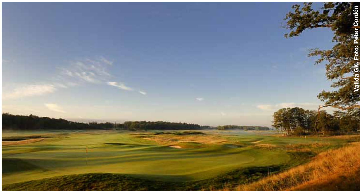
Vallda GK.

Gjennom mer enn 50 år har valget av frøblanding til greener på nordiske golfbaner vært påvirket av to 'skoler': Det er den britiske (skotske) skole som forfekter rødsvingelgreener, ofte med et visst innslag av engkvein, og den amerikanske skole som forfekter krypkveingreener.