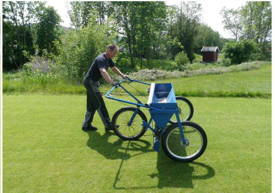
Gødskning med (a) flydende og (b) granuleret gødning i forsøgsparcer i Landvik, Norge.