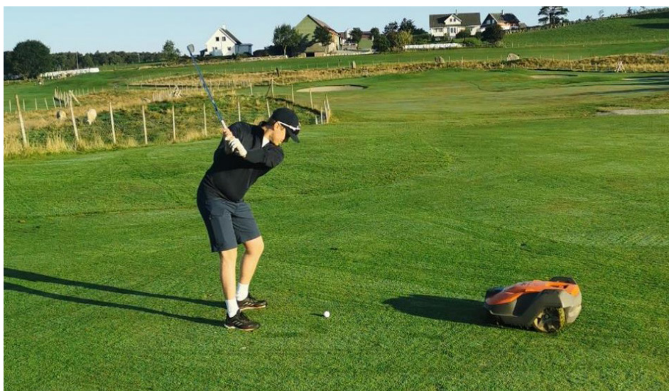
Foto 3: Spiller og robotklipper på Bærheim golfbane.

En del af spillerne bemerket at det savnet de rette, systematiske klippelinjene på fairway, men noen mente at denne ulempen ble mer enn oppveid av bedre klippekvalitet ved rotbotklipping. Flere mente at ballen ligger høyere på grunn av tettere og mer opprett gress på robotklippede fairways enn på sylinderklipte fairways der spillerne opplever enten 'medgress' eller 'motgress'. Noen spilleren trakk også fram de økonomiske og miljømessige konsekvenser av å skifte til robotklipping. En av spillerne uttrykte dette slik: 'Hvis rotbotklipping gir greenkeeperne bedre tid til å pleie greenene, lever jeg gjerne med et endret klippemønster på fairway.