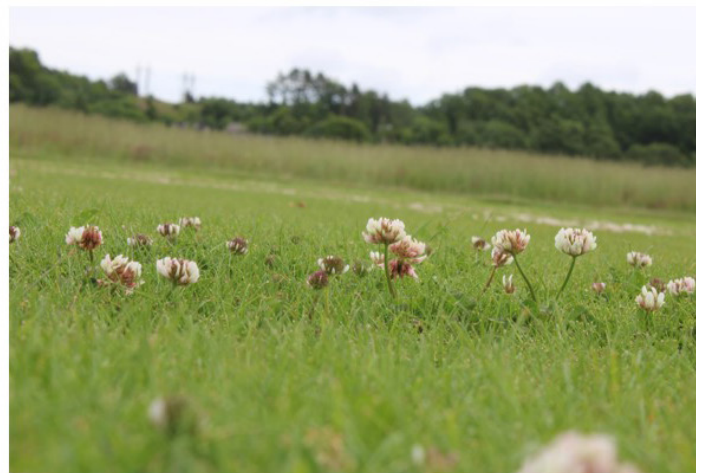
Foto 5: Fra fairway-forsøket på Landvik: Færre og lavere blomsterhoder av hvitkløver ved daglig robotklipping (t.v.) enn ved sylindertilipping tre ganger pr uke (t.h.).