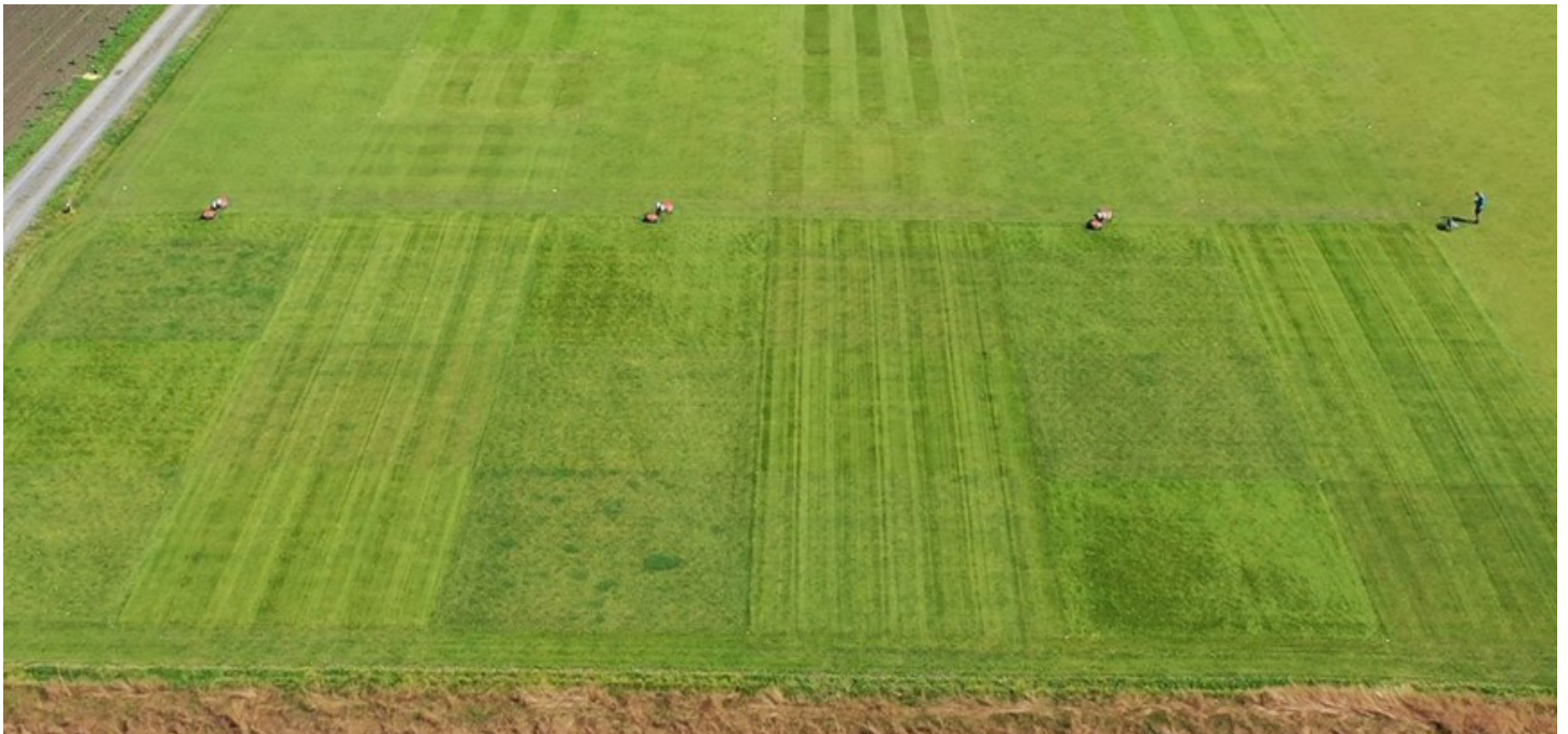
Foto 4: Fra ROBO-GOLF forsøkene på NIBIO Landvik. På fairway (15 mm klippehøyde) i den øverste halvdel av bildet er annenhver storrute klipt med hhv. robotklipper og sylindertilipper. På semi-rough i den nederste halvdel av bildet er annenhver storrute klipt med hhv. robot og rotorklipper.