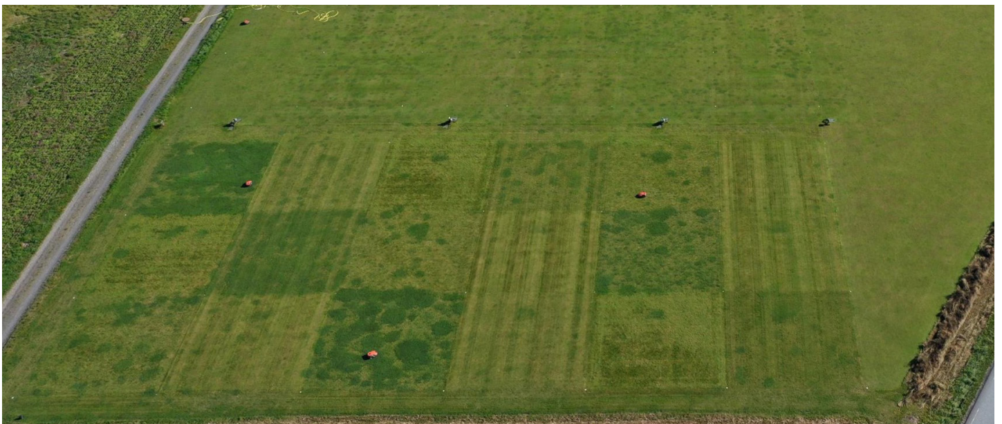
Foto 6: Samme areal som på foto 4 i august 2022. Legg merke til spredningen af hvitkløver (mørkegrønne flekker) i noen av rutene og spesielt i robotklippede ruter med flerårig raigras.