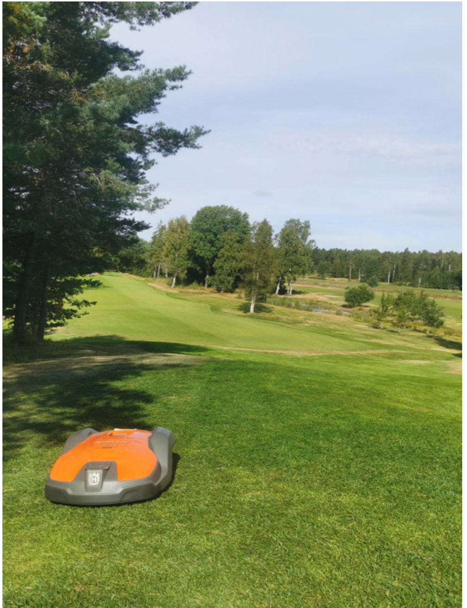
Foto 1: Husqvarna 550 robotklipper på Hirsala golf, Finland.

Detaljer om forsøkene på Landvik framgår av Hesselsøe et al. (2022b) og resulater fra prosjektet av www.sterf.org (Hesselsøe et al. 2022a).