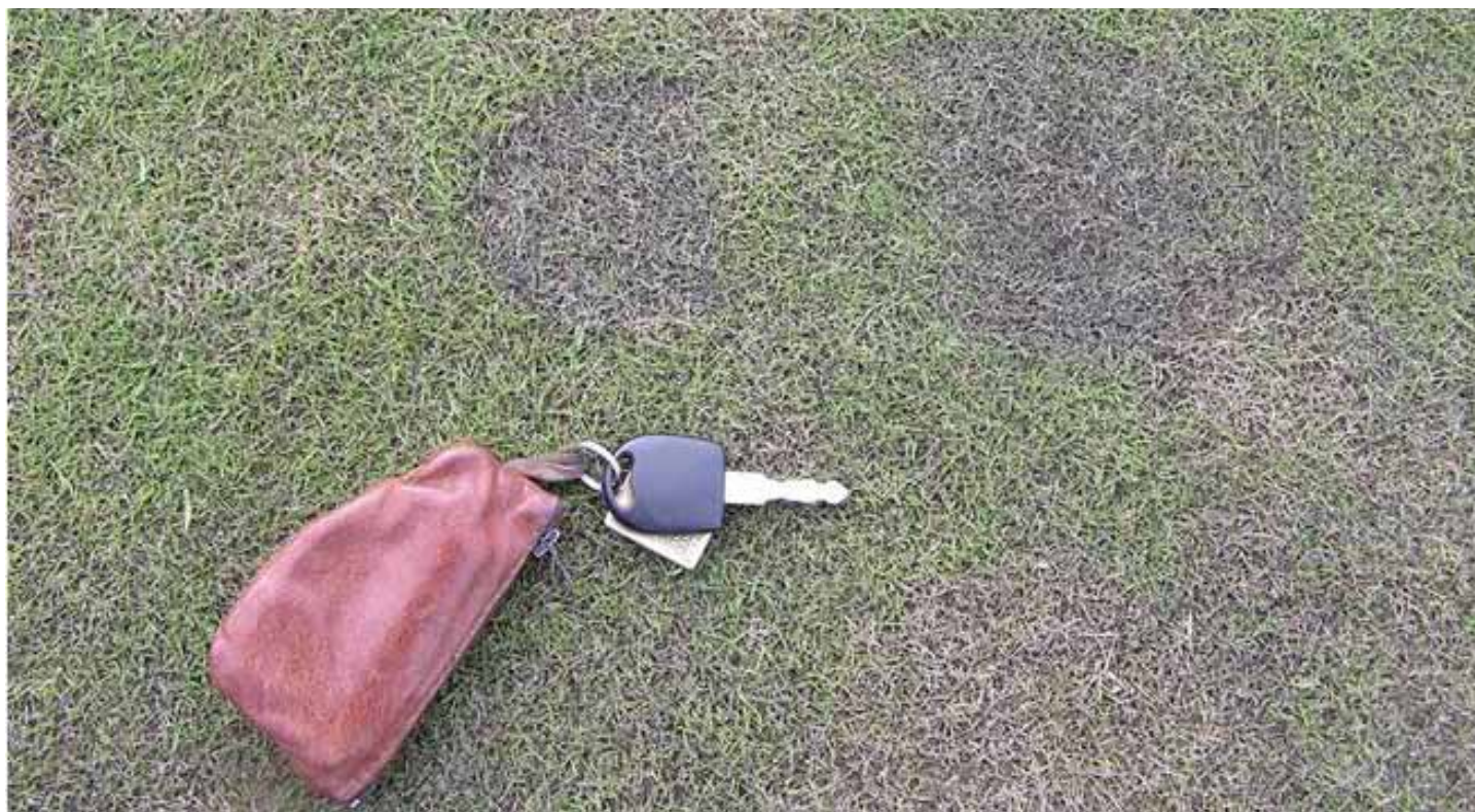
Fodaftryk efter første nattefrost.