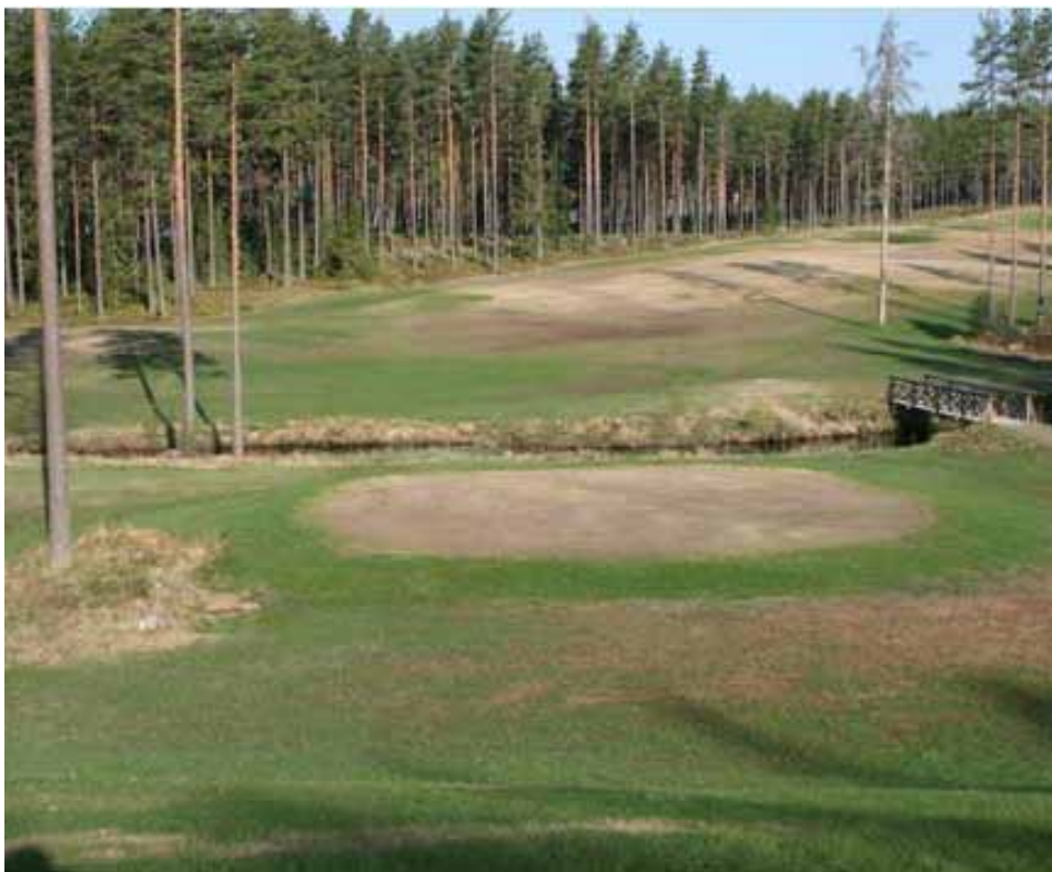
Isskader på tee og fairway 9/5/08.

For lidt vand er også en almindelig årsag til skader. Hvis planterne forbruger mere vand ved transpiration, end de kan absorbere, vil tilvæksten stoppet op, bladene visner og i værste fald kan tilvækstpunktet og udløbere dø.