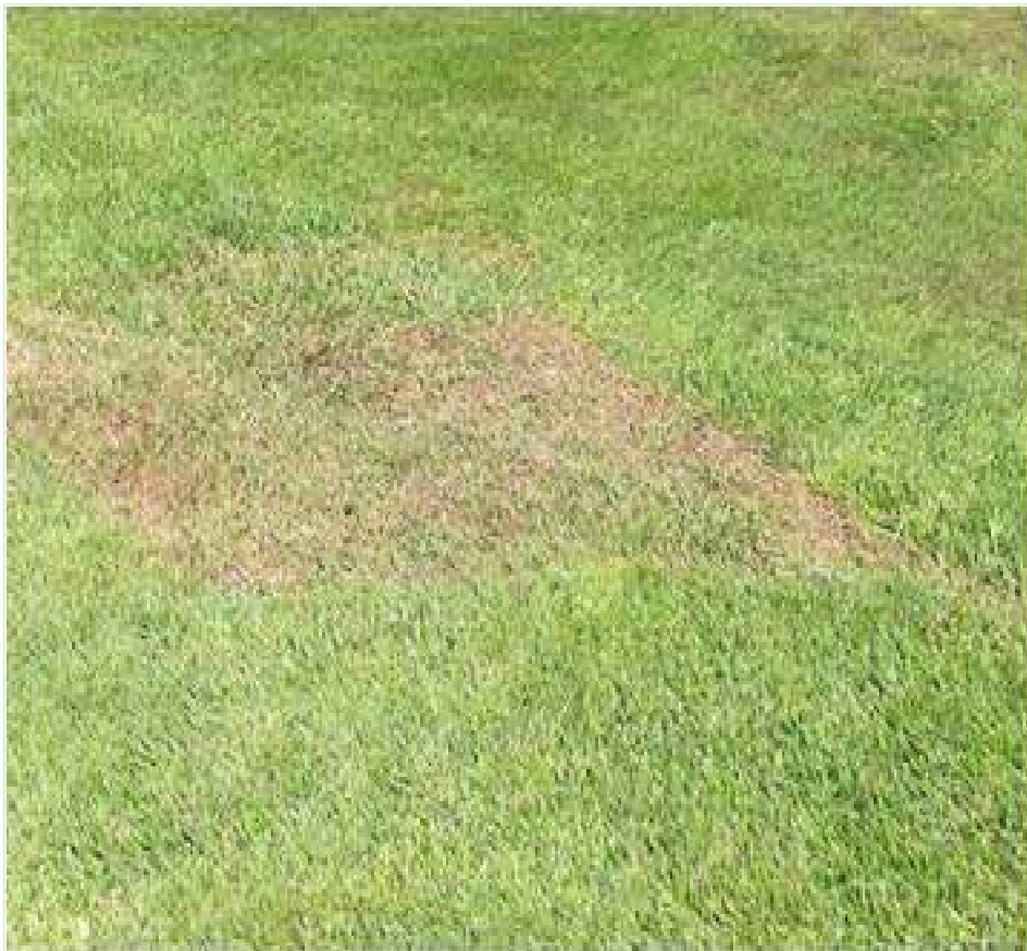
Ukrudtsmidlet Starane anvendt på en forgreen med ryggsprøjte.