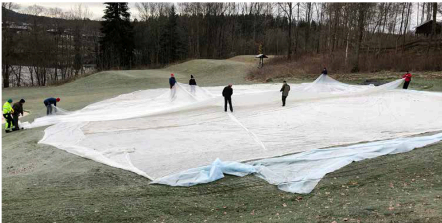
Kuva 1. Vihreiden peittämistä Askerin golfkentällä marraskuussa 2019.

Tämä tietosivu perustuu läpäisemättömien peitteiden tutkimustuloksiin ICE-BREAKERissä (2020–2023) sekä aikaisemmissa STERF-rahoitteisissa projekteissa (esim. Rannikko & Pettersson 2010, Waalen ym. 2017). Erityistä huomiota kiinnitetään kokemuksiimme Hagan, Bærumin, Askerin ja Holtsmarkin golfkentiltä, jotka kaikki sijaitsevat 10–30 km Oslostä länteen. Ennen vuotta 2023 on näiden kenttien viheriöt peitetty viitenä peräkkäisenä talvena (kuva 1).