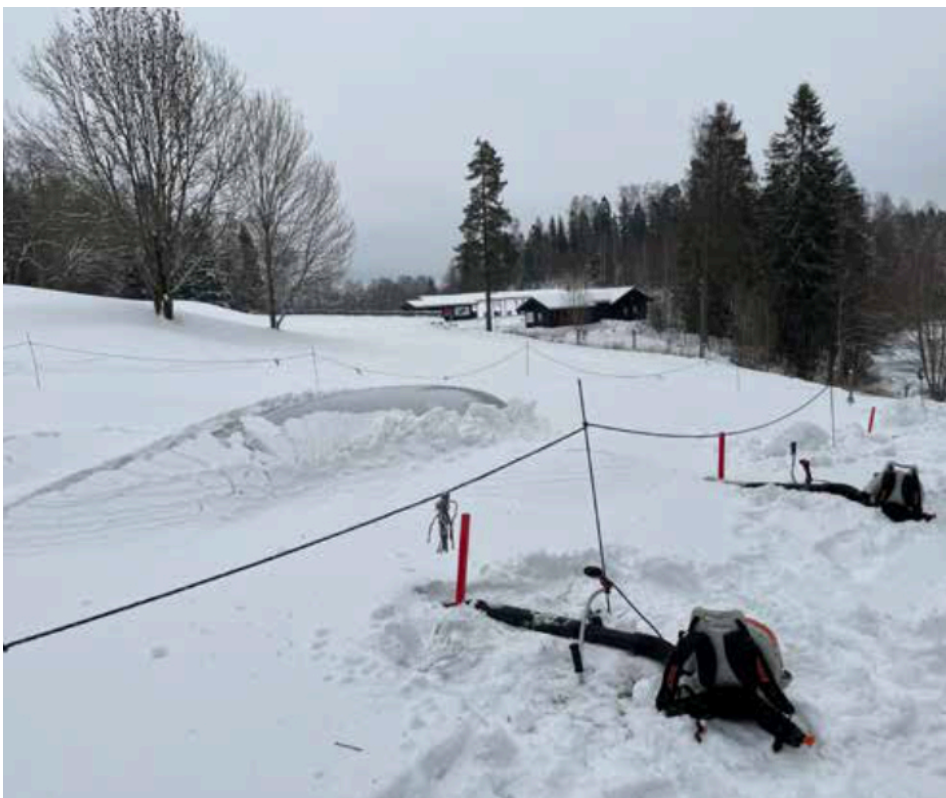
Kuva 8. Muovilla peitetyn viheriön tuuletusta Askerissa alkutalvella 2021–22.

Ilmanvaihtojärjestelmästä riippumatta on tärkeää, että putkien suut merkitään pystypylväillä, jotka ovat helposti löydettävissä myös paksun lumipeitteen aikana.