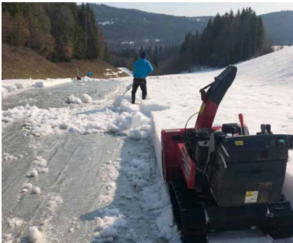
Kuva 9. Lumen poisto lämpisemättömän peitteen päältä saattaa olla tarpeen, jos O 2 -pitoisuudet ovat alle 2 %.

Normaalimpana talvena voi lämpisemättömät peitteet yleensä pitää viheriöillä, kunnes lumi sulaa luontaisesti maaliskuun alkuun. On kuitenkin tärkeää seurata olosuhteita peitteiden alla, jotta happipitoisuudet eivät laske alle 2 %:iin. Jos ilmanvaihtojärjestelmä ei näytä toimivan, voi olla turvallisempaa poistaa lumi (kuva 9) ja/tai levittää hiiltä tai muuta mustaa ainesta lumen ja jään sulattamiseksi.