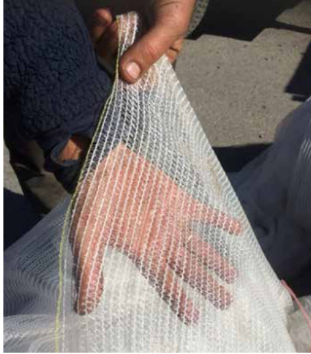
Kuva 6. Golfkentillä on suositeltavaa asentaa muovin alle läpäisevä harso.

Kentänhoitajille voi myös olla eduksi, että harsot on asennettu jo ennen talvea, sillä niitä tarvitaan mitä todennäköisimmin suojaamaan viheriötä pakasilta tai kuivaavilta tuuilta, kun läpäisemättömät peitteet on poistettu keväällä.