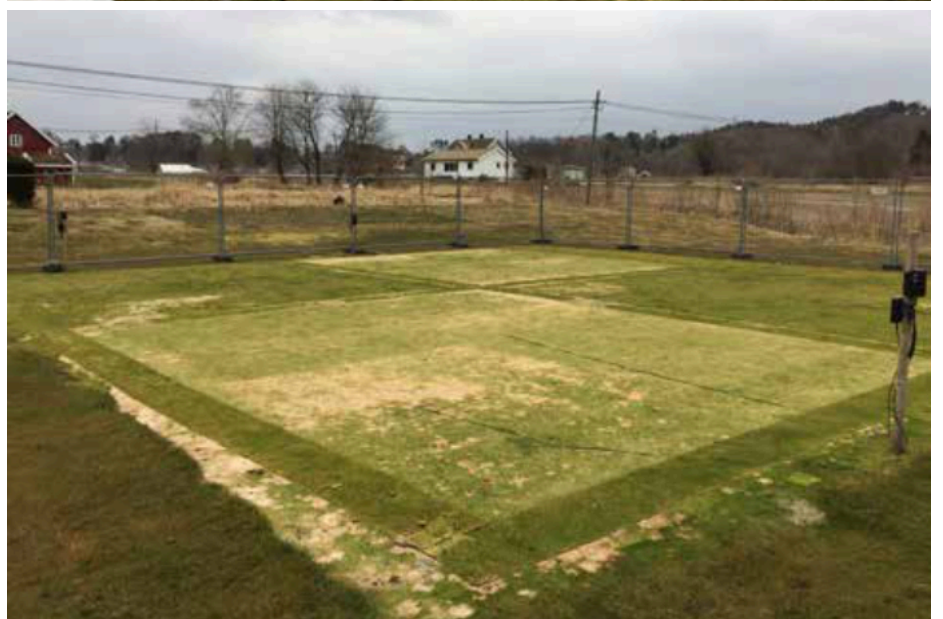
Kuva 3 a. b. Peitteen ja sienitautien kokeesta puhtaalla Poa-viheriöllä NIBIO Landvikissa vuosina 2022–23. Viheriö jaettiin neljään osaan, joista kaksi jäi peittämättä ja kaksi peitettiin 1. joulukuuta käyttämällä mustavalkoisia muovia valkoinen puoli ylöspäin. Peitetyt alat näyttivät upeilta, kun muovit poistettiin 21. maaliskuuta (yläkuva), mutta ne menettivät pian värin ja laadun altistuttuaan normaaleille valo- ja happipitoisuuksille. Huhtikuun 10. päivään mennessä (alakuva) oli peittämättömien kontrollialojen nurmen laatu parempi kuin peitetyillä aloilla.