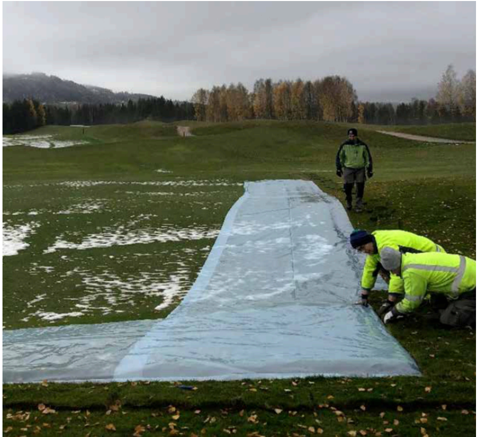
Kuva 5. Tärkeä valmistelu on muovisten kaulusten kaivaminen viheriön ulkopuolella oleville korkeammille reuna-alueille. Tässä tapauksessa voidaan harso ja läpäisemätön peite kiinnittää kauluksen alle, jotta sulamisvettä ei pääse tihkumaan peitteiden alle.

Jotkut kenttämestarit harjoittavat voimakasta dressausta vähän ennen peittämistä, mutta tälle ei ole selkeää syytä, koska viheriöillä on vähän liik-