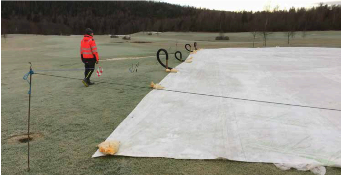
Kuva 2. Green Jacket -peite ilmanvaihtojärjestelmällä Hagan golfkentällä, marraskuu 2021.