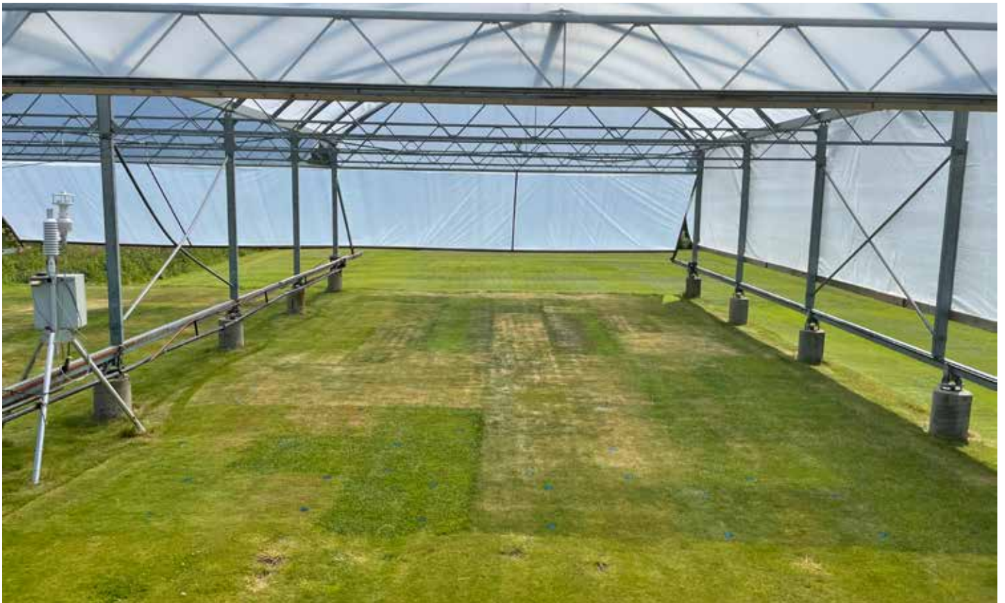
Foto 2 a,b. To af fire gentagelser lige efter vanding til markkapacitet ved forsøgets (tørkeperiodens) begyndelse 30.april (øverst) og ved afslutningen af tørkeperioden (maksimal tørke) 25.juni (nederst). Grønne parceller forrest på det nederste billede er strandsvingel (kolonne nr 3 fra venstre) og alm. rajgræs (kolonnerne længst til højre).