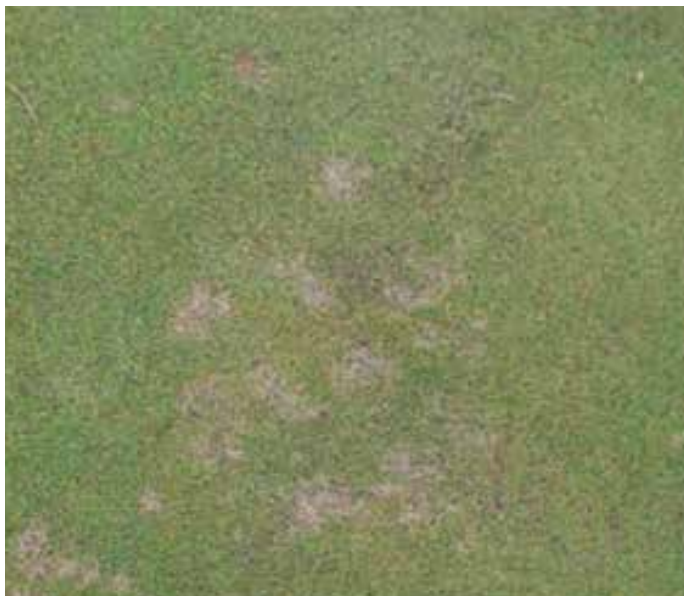
Dollaraflökkur á flöt.