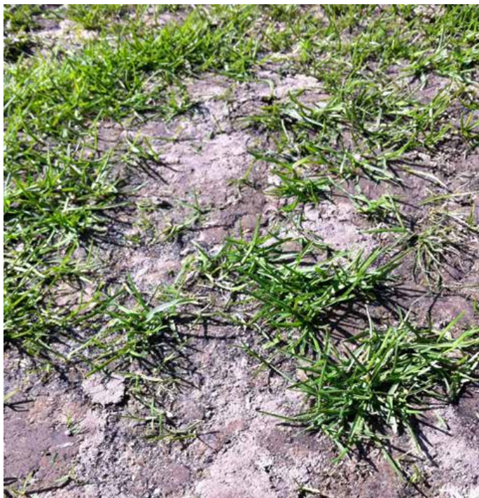
Vinstri og hægri: Upprótaður jarðvegur eftir orma.

Sýkingar: Microdochium -sveppur og dollaraflekkur. Sveppalyf eru ekki notuð, en úðað er á einstaka illgresisbletti.