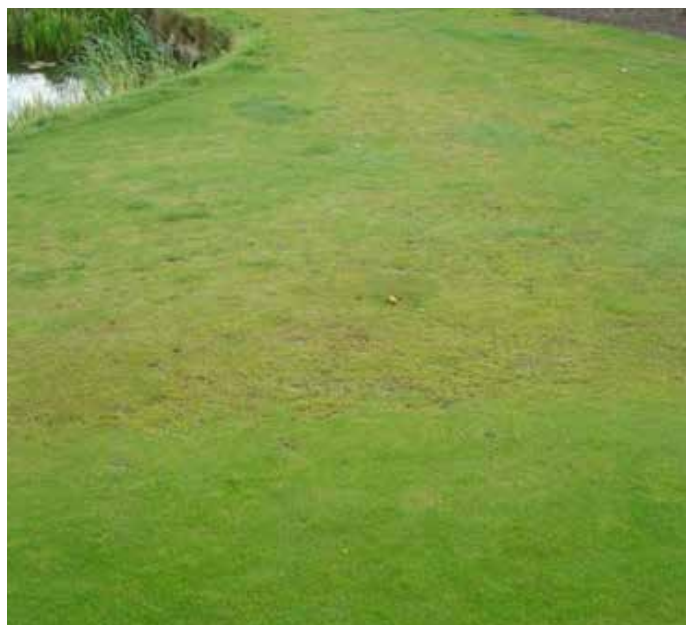
Varpasveifsgras er að ná undirtökunum á blautum svæðum.

Helsti vandinn sem starfsmenn á Vallø standa frammi fyrir er baráttan við varpasveifsgras og annað illgresi. Til að gera rauðvingli kleift að ná undirtökunum hefur mikill hluti vinnunnar snúist um að bæta þurrkun og fráveitu svo yfirborð og jarðvegur verði sem þurrastur.