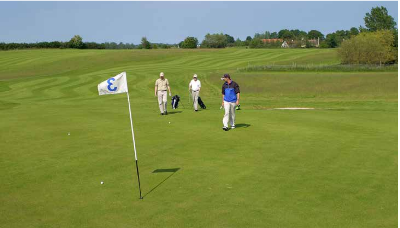
Frá Vallø-golfvælinum í Danmörku.