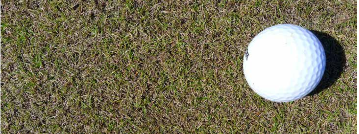
Rauðvingull á Visby-golfvöllinum í Gotlandi í Svíþjóð.