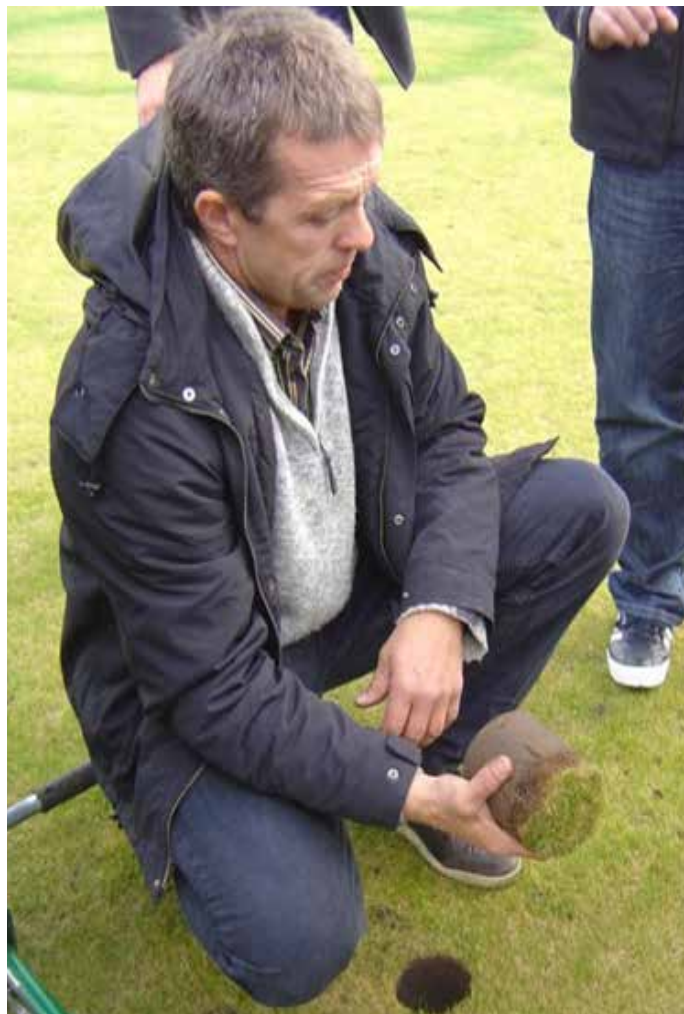
Holutappi tekinn úr einni brautanna á Vallø. Greinilegt plöntuúrgangslag hefur myndast efst í leirkenndum jarðveginum.

Þetta úrgangslag er nú um 2-3 cm þykkt. Þetta hefur gerst þrátt fyrir að brautir hafi fengið um 50 kg af köfnunarefni (N) á hvern hektara á ári, síðastliðin tvö ár, en fyrir þann tíma liðu tvö ár án áburðargjafar. Vegna þessa má búast við allmörgum nornahringjum (e. Fairy rings) á brautum.