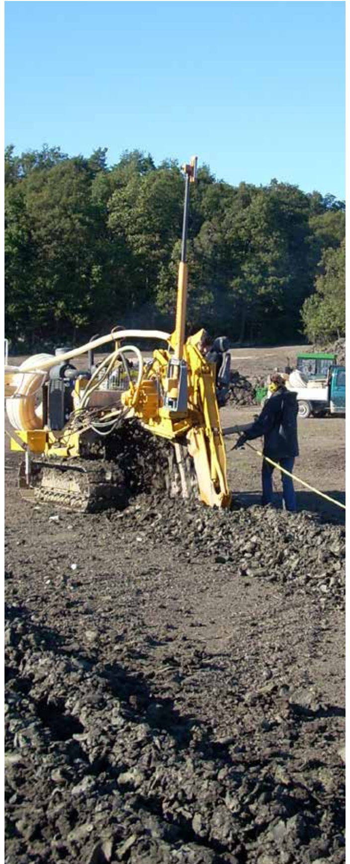
Þurrkunarskurðir grafnir á Vallða-vellinum.

Vetrarþol rauðvinguls er vanmetið í bandarískum kennslubókum. Harðgerðasta undirtegund rauðvingulsins, ( Festuca rubra commutata ), fær hærri einkunn en skriðlíngresi (e. creeping bentgrass, lat. Agrostis stolonifera ) í norrænum yrkjarannsóknum. Á hinn bóginn er undirtegundin Festuca rubra litoralis (einnig lat. trichophylla , e. Slender creeping red fescue) viðkvæmari fyrir vetrarskaða og stendur þar jafnfætis hálíngresi (e. common bentgrass, lat. Agrostis capillaris ). Algengasta orsök vetrarskaða á Norðurlöndunum er svellkal, þ.e. köfnun undir svelli. Vissulega leggjast sveppasýkingar á rauðvingul, aðallega hinn margumtalaði Fusarium -sveppur (lat. Microdochium nivale ), en sjaldgæft er að plönturnar drepist af völdum þeirra. Fæstir notuðu vallarstjórnir okkar sveppalyf í fyrirbyggjandi skyni að hausti.