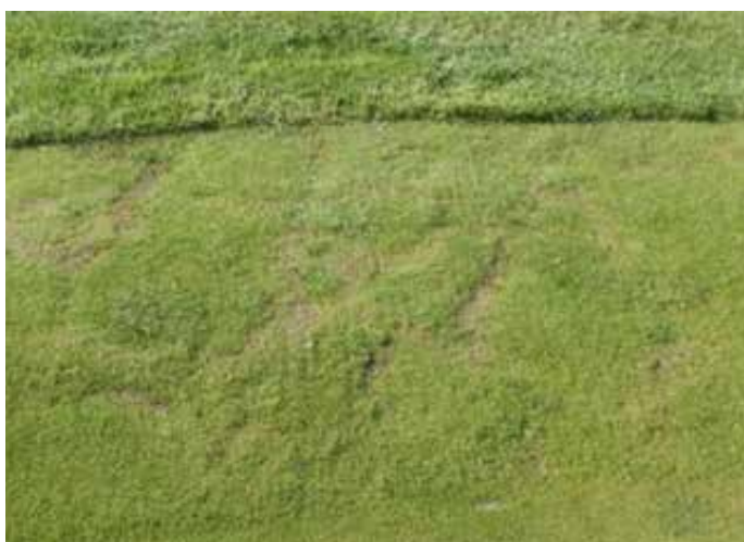
Alvisnunarflekkir (e. Take-all) á 15 ára gamalli flöt.

Útlit er fyrir að þetta megi rekja til þess að síðastliðinn áratug hefur flötunum verið gefið fremur lítið köfnunarefni (N). Rannsókn sem framkvæmd var á Smörum árið 2012 leiddi í ljós að flatir með meira N sýktust síður af dollaraflökk. Smörum ætlar þess vegna að auka N-gjöf sína lítið eitt, í tveimur til þremur