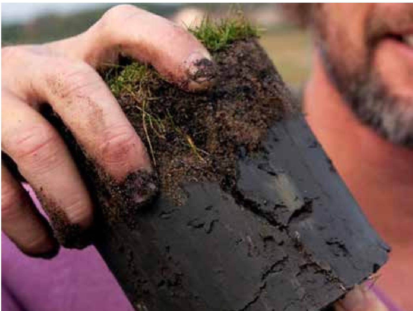
Holutappi tekinn úr einni af brautum á Vallða.

Einnig er nauðsynlegt að sanda vandlega og gata reglulega. Hugmyndin er sú að lífrænt hlutfall eftir söndun fari aldrei yfir 3,5%.