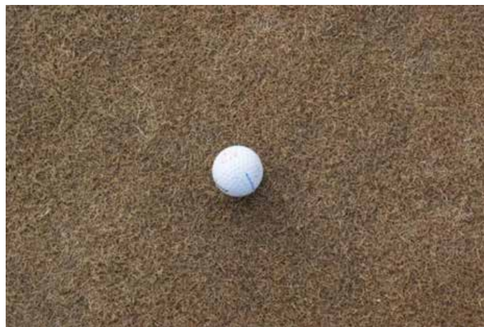
Brúnleit flöt snemma vors á Smörum-golfvellinum.

Þá eiga flatirnar það til að missa talsverðan lit, sérstaklega á veturna og snemma á vorin. Þetta er þó ekki hættumerki. Að litnum undanskildum, þá getur flötin verið mjög góð, gefið jafnt og gott rennsli og mikinn hraða. Dæmi eru um að hraði flatanna hafi mælst umfram 13 fet á Stimp-kvarðanum í febrúar og mars.