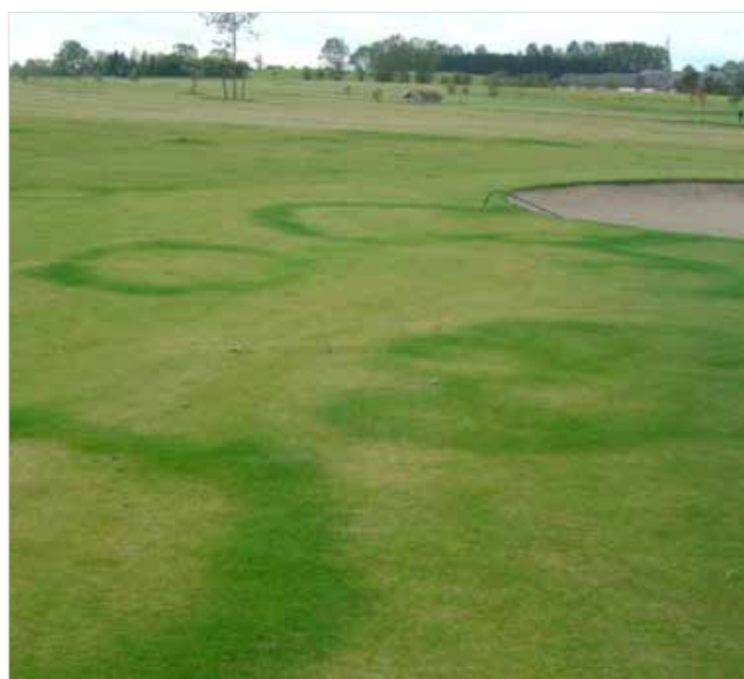
Nornahringir á brautum.