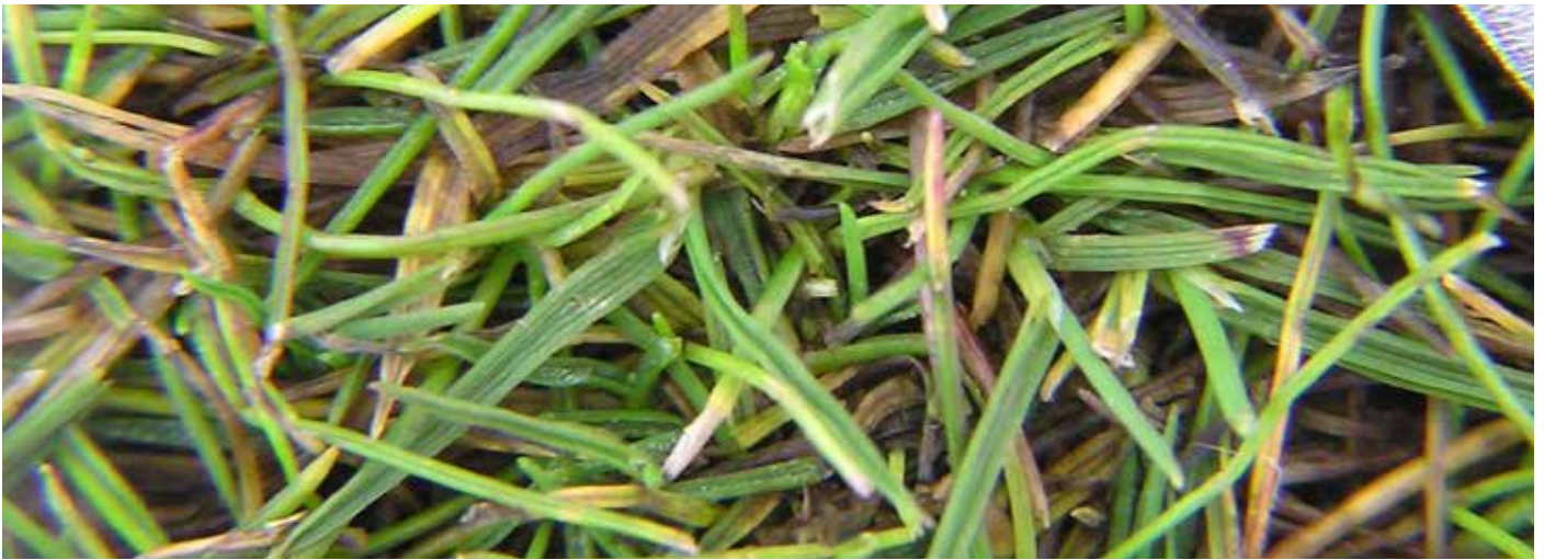
Rannsóknir í Skandinavíu hafa leitt í ljós að blanda rauðvinguls og hins svokallaða flauelslíngresis ( Agrostis canina ) kunnir að reynast betur en hin hefðbundna blanda rauðvinguls og hálíngresis ( Agrostis capillaris ). Hið fyrrnefnda hefur finni blöð, er nægjusamara og þarf því minna vatn og næringu en hálíngresið. Myndin er frá Drotninglund í Danmörku.