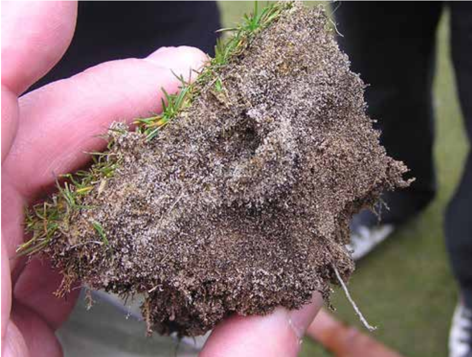
Lífrænt úrgangslag rauðvinguls, sem fær hóflegt viðhald, er frábrugðið hinu svampkennda lagi sem við þekkjum frá öðrum grastegundum. Myndin er frá gamla velinum í St.Andrews.

fram í mars og sú síðasta í nóvember, sjá dæmi 4. Á þessum velli var notast við hreinan sand til söndunar. Á öðrum völlum var notast við sand sem blandaður var moltu. Fram kom í máli söluaðila á slíkum sandi, sem sótti ráðstefnuna, að 6-8 mm þykk söndun á ári jafngildi 30-40 kg. af köfnunarefni á hvern hektara á ári. Hinn moltublandaði sandur inniheldur einnig fosfór og aðra næringu.