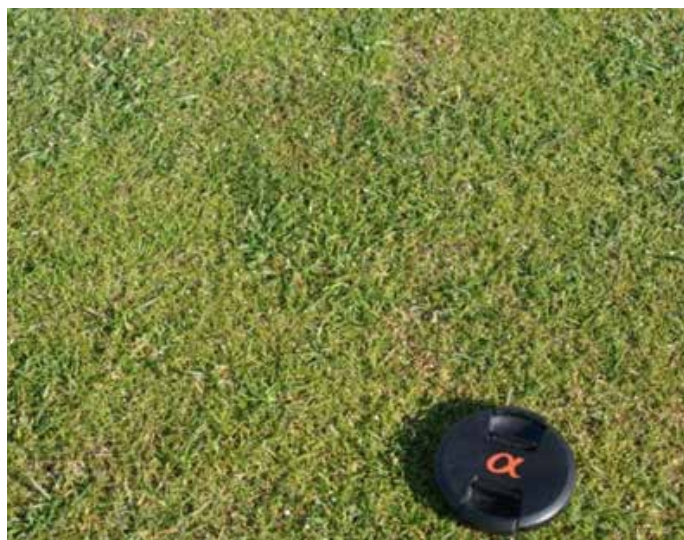
Hér sést vel hversu hratt língresið vex umfram rauðvingul að vori.

Leikyfirborð á það til að verða ójafnt á blönduðum rauðvinguls- og língresiflötum á vorin. Língresið byrjar fyrr að vaxa og grófari blöð þess skapa þess vegna ójafnt rennsli. Fyrir vikið þarf að slá flatir fyrr á vorin.