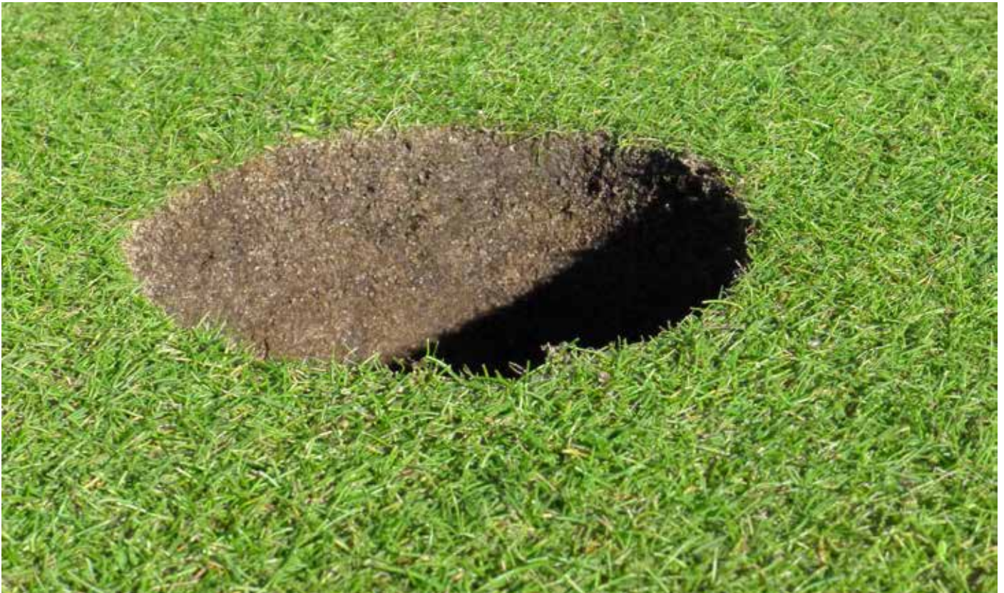
Nærmynd af flatarsverði á Furesø-golfvællinum. Þarna glittir í eina staka varpasveifsgrasplöntu á holubarminum.

Að ýmsu þarf að gæta til að skapa nægilega hentugar aðstæður svo rækta megi rauðvingul á flötum. Mjög erfitt er að rækta hann ef yfirborðið er ekki nægilega þurr, ef framræsla eða þurrkun er ekki nægilega góð og eins á flötum sem safna til sín vatni utan frá. Þegar stefnt er að því að nota rauðvingul víðar en á flötum, þá er mikilvægt að haga umhverfi flata þannig að umferð og álag dreifist sem best. Ef þörf krefur gæti þurft að leggja fleiri eða lengri stíga til að hlífa grassvæðum.