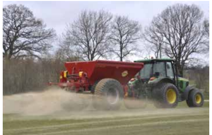
Kröftug söndun á brautum með grófum sandi, sem er laus við kalkstein, í bland við smákorna sand með hvössum kornum.

Reynt hefur verið að yfirsá hressilega, en árangurinn er takmarkaður. Rauðvingull virðist aðeins ná fótfestu þar sem jarðvegur er þurr.