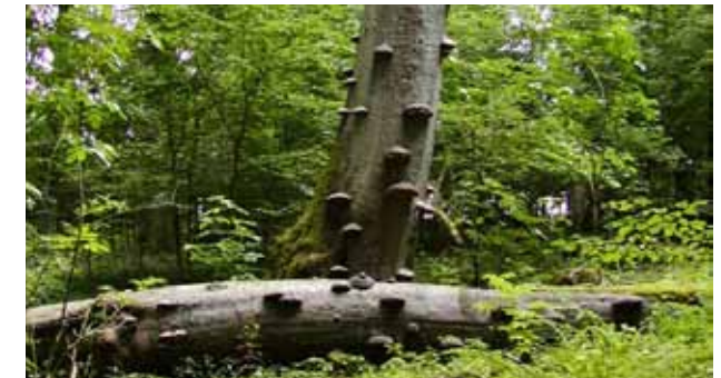
Fræðsla skiptir miklu máli. Ekki er á allra vitorði að dauður víður getur gegnt lykilhlutverki í lífríki margra skógargolfvalla.

sýna þróun gróðurs til framtíðar, háum sem lágum. Velja skal tegundir út frá forsendum leiksins, landslags og lífríkis. Þá er æskilegt að klúbburinn komi sér upp umhirðuáætlun sem lágmarkar áburðargjöf og notkun hvers kyns plöntulyfja og varnarefna.