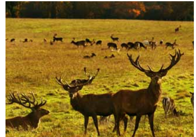
Í Jägerborg-dýragarðinum er golf leikið innan um tvö þúsund villt dádýr.