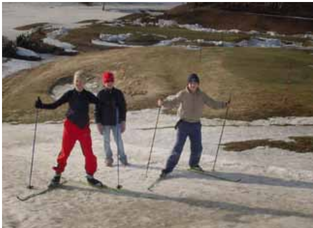
Oppegård-golfvöllurinn er vel nýttur allt árið. Golf á sumrin, skíði á veturna.

Leigusamningur sveitarfélagsins við golfklúbbinn kveður á um að nota megi völlinn undir vetraríþróttir þegar þannig árar. Skíðafélag staðarins hefur tekið að sér að ryðja og annast skíðagöngubrautir og fleira þess háttar. Félagið hefur m.a.s. komið upp varanlegri snjóvinnsluvél, sem notar vatn úr tjörnum golfvallarins.