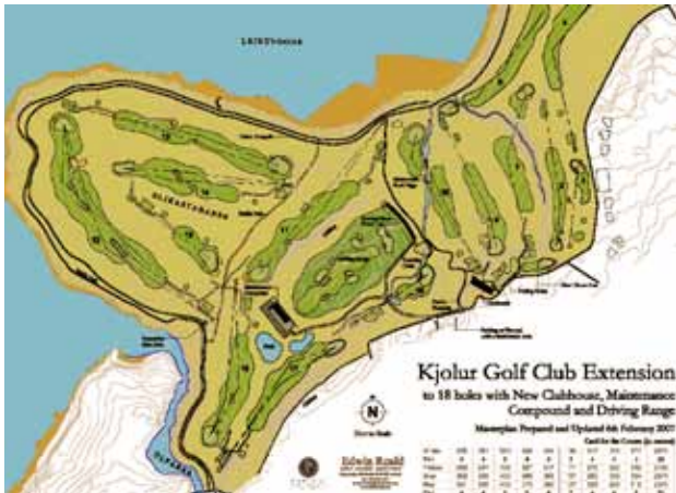
Göngu- og reiðstígar umhverfis og í gegnum Hlíðavöll gera öllum kleift að njóta hins fallega Blikastaðanes.

Golfklúbburinn þarf að sníða starfsemi sína að þessu, sem og þeim tvö þúsund dádýrum sem þar má finna og setja mikinn svip á umhverfið. Tvisvar á ári þurfa kylfingar að víkja fyrir reglubundnum viðburðum eins og Hubertus-hátíðinni, þar sem mikill fjöldi hesta, knapa og áhorfenda kemur saman, og Hermitage-hátíðinni, þar sem leið um 20 þúsund hlaupara og áhorfenda liggur um golfvöllinn.