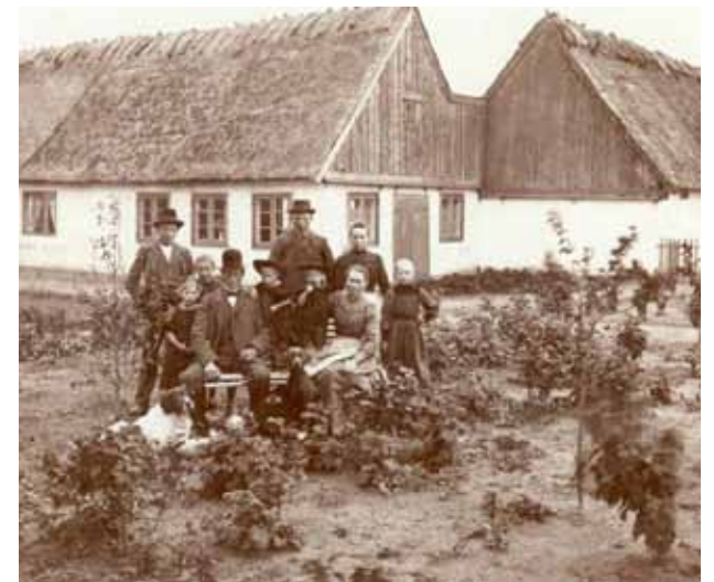
Smörum Golf Center leggur mikið uppúr menningarlegum arfi sínum og sögu. Skammt frá klúbbhúsi er forn grafreitir.

SMÖRUM GOLFCENTER opnaði 1993. Á völlum eru alls níu skrásettir grafreitir. Árið 1997 gerði Smörum samkomulag við yfirvöld um hirðu á tveimur þessara reita. Grasið á þeim er slegið og lággróðri haldið í skefjum svo reitirnir, eða hólarnir, eru vel sjáanlegir úr fjarlægð. Þá hafa fornleifafræðingar, í samstarfi við Smörum, ráðist í nokkur minni verkefni á völlum og m.a. fundið leifar frá járnöld og bronsöld. Einnig hafa komið í ljós skurðir, sem sumir hafa verið klæddir að innan með grjóti, sem bera vott um búskap