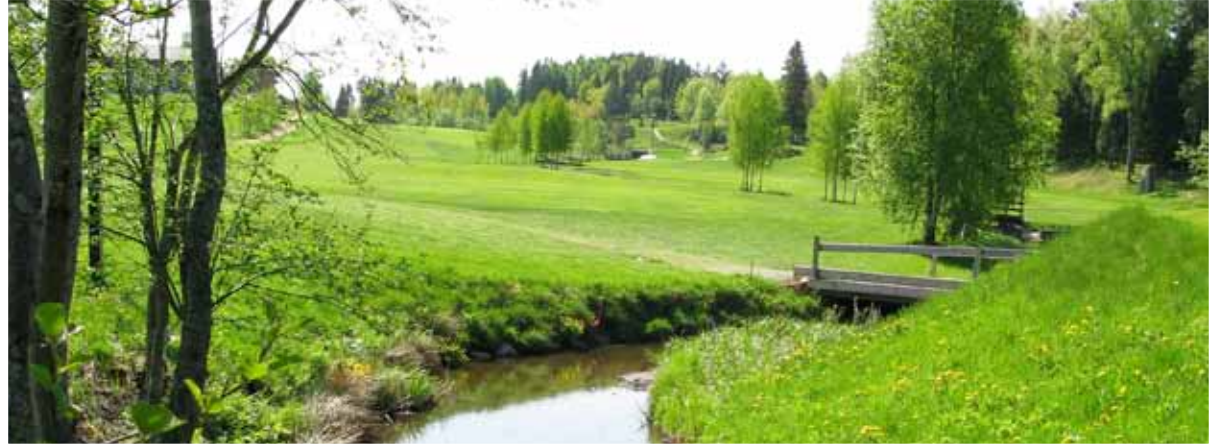
Styrkleikar og verðmæti gagnvart náttúru og menningararfi voru kortlögð í samvinnu milli OPPEGÅRDS-GOLFKLÚBBSINS, STRI and NORSKA GOLFSAMBANDSINS .

Árið 2003 vildi KRISTIANSTAD-GOLFKLÚBBURINN í Svíþjóð kaupa land af sveitarfélaginu til að byggja nýjan 18-holna völl. Landslagið í kringum Áhus er