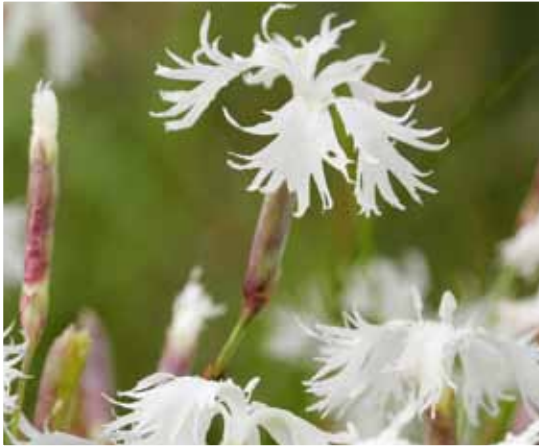
Dianthus arenarius er sjaldgæf, en vex villt á KRISTIANSTAD-VELLINUM í Svíþjóð.

Því að allur uppgröftur úr þessum sömu grunnum og hliðstæðum framkvæmdum færi í mótun golfvallarins. Fyrirséð var að þessi samnýting kæmi í veg fyrir að þúsundum bílfarmanna af möl og jarðvegi yrði ekið gegnum Mosfellsbæ, með tilheyrandi mengun, truflun og kostnaði. Samstarf af þessu tagi getur þannig náð fram sjálfbærni á öllum þremur grunnsviðum hennar; þ.e. hvað varðar umhverfisvernd, ávinning fyrir samfélagið og ekki síst efnahagslega.