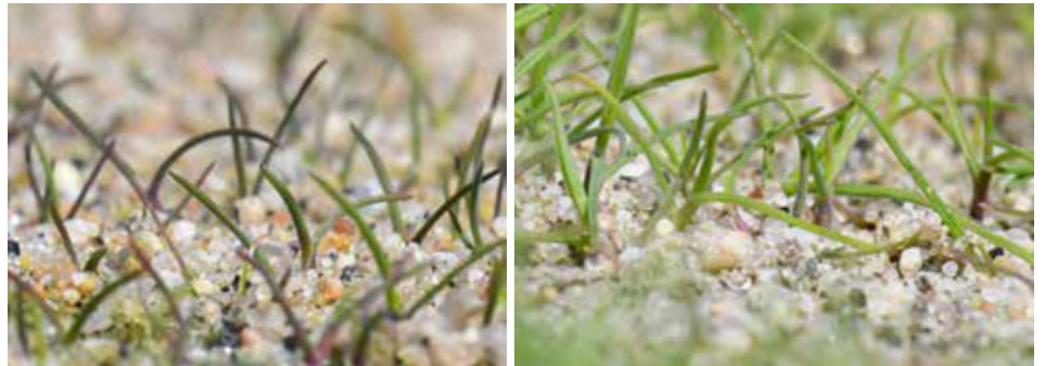
Harsojen vaikutus nurmen suojaamiseen valostressiltä (fotoinhibitiio): Ilman harsoa kasvatetut taimet vasemmalla ja Evergreen-harson alla kasvatetut taimet oikealla.