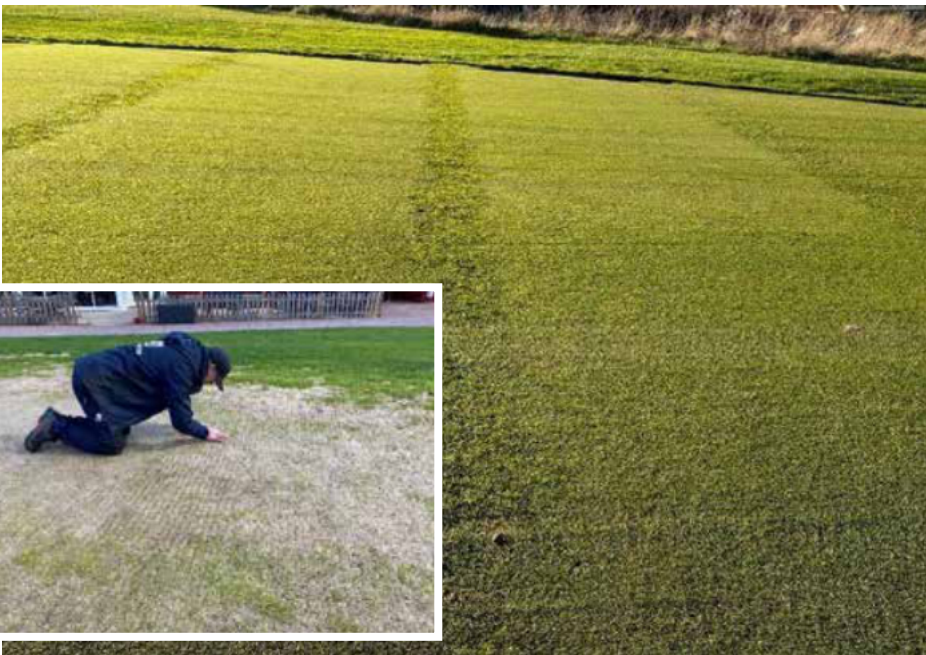
Vasemmalla: Taimien tarkistus rivikylvön jälkeen talvella vaurioituneella yksivuotista kylänurmikaa kasvaneella viheriöllä Rättviksin golfkentällä Pohjois-Ruotsissa. Oikealla: Syksyllä 2024 rönsyröllillä on laajenemassa yksivuotisen kylänurmikan kustannuksella.

Nämä kokemukset tulisi ottaa huomioon, kun arvioidaan siirtonurmetuksen kokonaiskustannuksia. Siirtonurmi täytyy myös aina asentaa huolellisesti, ja kerroksellisuutta tulee mekaanisesti hoitaa seuraavien kahden vuoden aikana joko holkituksen tai pystyleikkueen avulla.