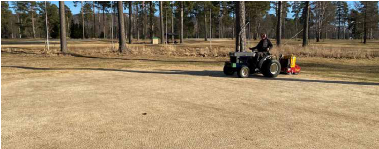
Rättviksin golfkenttä, kevät 2022.