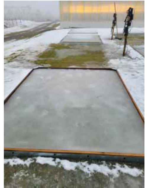
Kasvua estävien yhdisteiden vaikutusten tutkimiseksi punanadalla ja rönsyröllillä kylvetyt viheriöt, joissa oli 2–3 cm:n kuitukerros (vasemmanpuoleinen kuva), peitettiin jääkerroksella 3 kuukauden ajaksi talvella 2021 ja 4 kuukauden ajaksi talvella 2022 (oikeanpuoleinen kuva).