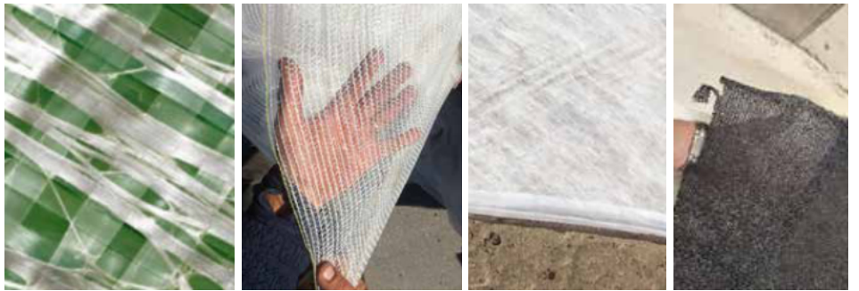
NIBIO-Landvikissa vuosina 2021 ja 2022 testatut harsoit: (vasemmalta oikealle) 'Evergreen', 'Norgro', 'Agryl' ja 90 % varjoverkko.