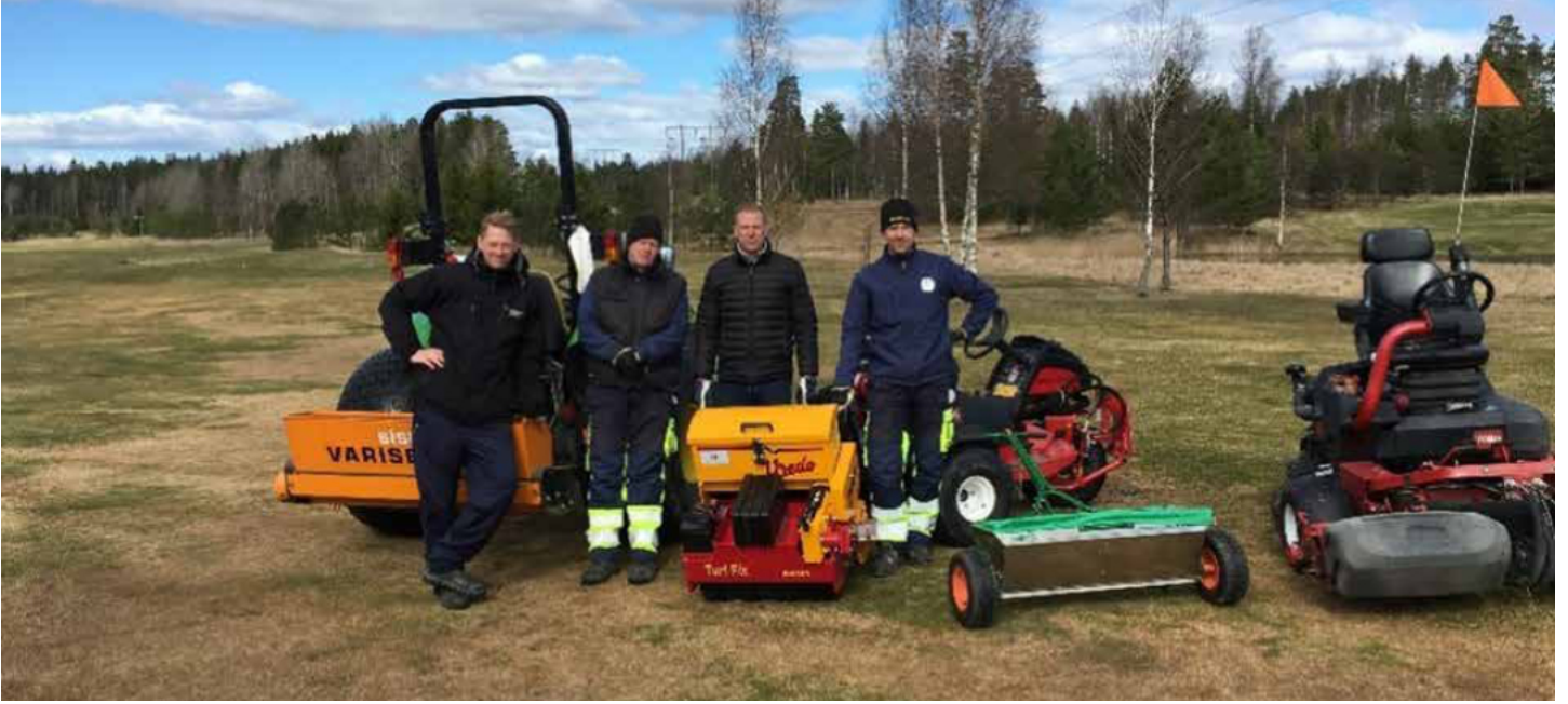
Uudelleenkylvömenetelmien testauksessa käytetyt koneet. Surahammarsin golfkenttä, kevät 2017.

Hyvä siemenen ja maaperän välinen kosketus sekä oikea kylvösyvyys voidaan saavuttaa käyttämällä koneita, jotka tekevät viiltoja tai pieniä reikiä viheriön pintaan. Keski-Ruotsissa vuosina 2017–2018 tehdyissä kokeissa verrattiin kahta hajakylvömenetelmää sekä rivikylvöä yksivuotisesta kylänurmikasta kuolleilla viheriöillä. Tulokset osoittivat, että rivikylvö tuotti parhaan peittävyuden sekä rönsyröllillä että karheanurmikalla. Kylvön jälkeen viheriö tulisi aina hiekoittaa keskikarkealla hiekalla, johon on sekoitettu turvetta, kompostia tai muuta tummaa ainesta. Tumma väri auttaa lämmittämään pintaa keväällä, edistäen siementen itämistä.