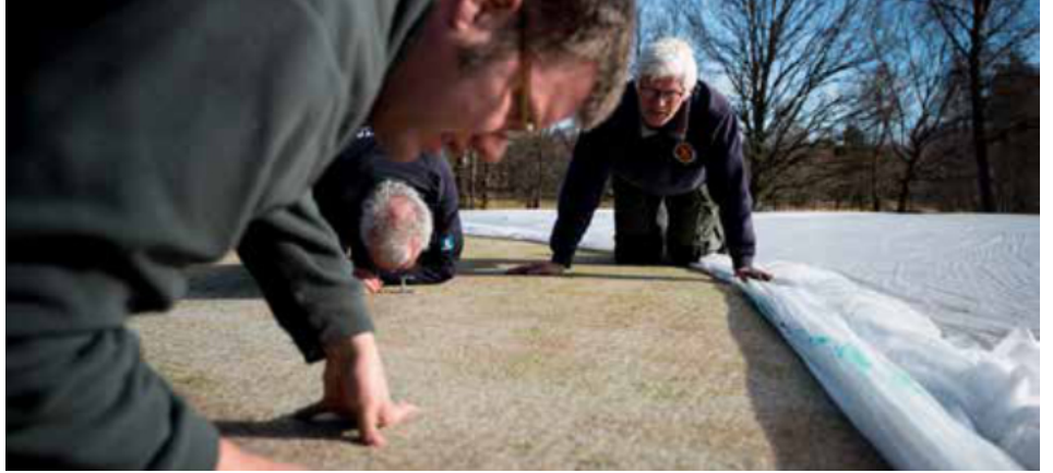
Uudelleenkasvun tarkistus harsojen alla.

Keväällä 2022 koe toistettiin, ja siihen lisättiin myös 90 % varjoverkko, jotta voitiin arvioida, mikä ratkaisusta parhaiten tasapainottaa lämpötilan ja valon yhteisvaikutuksia. Yllättäen varjoverkko paransi taimettumista merkittävästi ensimmäisten kolmen viikon aikana, vaikka se ei nostanut maan lämpötilaa. Kahden vuoden kokeiden perusteella voidaan todeta, että 'Evergreen' oli tehokkain harso maan lämpötilan nostamisessa ja taimettumisen nopeuttamisessa kylvön jälkeisten ensimmäisten viikkojen aikana.