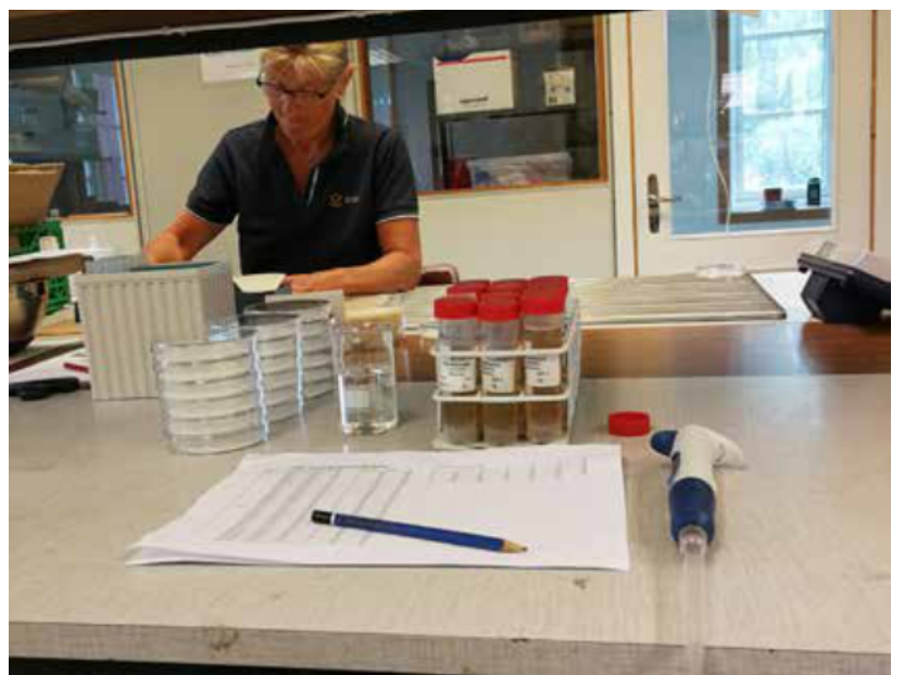
Jääkerroksen alla olleilta viheriöiltä otettiin maanäytteet heti jään sulamisen jälkeen huhtikuun alussa (vasemmanpuoleinen kuva), ja kuitukerroksesta analysoitiin mahdollisia myrkyllisiä yhdisteitä (oikeanpuoleinen kuva).