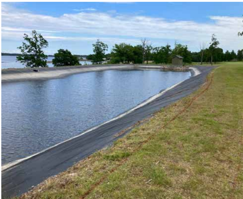
Bilde 1. Vanningsdam på Västervik GK med blanding av brakkvann fra Østersjøen og overflatevann fra boligområde i nærheten.