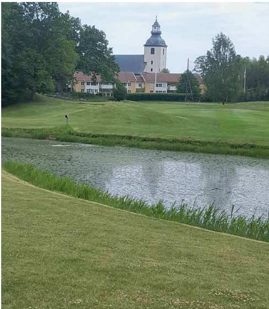
Bilde 2. Loftahammar GK vanner med avløpsvann fra renseanlegg.

Ved Ronneby var EC w i vanningsvannet 4,6 dS m -1 i juni 2025 og 5,0 dS m -1 i august 2025 (tabell 2). Dette er et urovekkende høyt saltinnhold som normalt vil kreve overskuddsvanning for å unngå at salt hopper seg opp i vekstmassen. Sodisiteten i vanningsvannet var også høy, med SAR-verdier på henholdsvis 21 og 28, langt over grenseverdien på 10. Den høye sodisiteten i vanningsvannet gjenspeilet seg i jordanalysene, der ESP var nær 30 % i august 2025 (tabell 3), også dette langt over anbefalt grense på 15 %. Av de sju golfbanene var det altså Ronneby som hadde de mest kritiske analyseverdiene, men heller ikke her ble det påvist synlige saltskader i 2025.